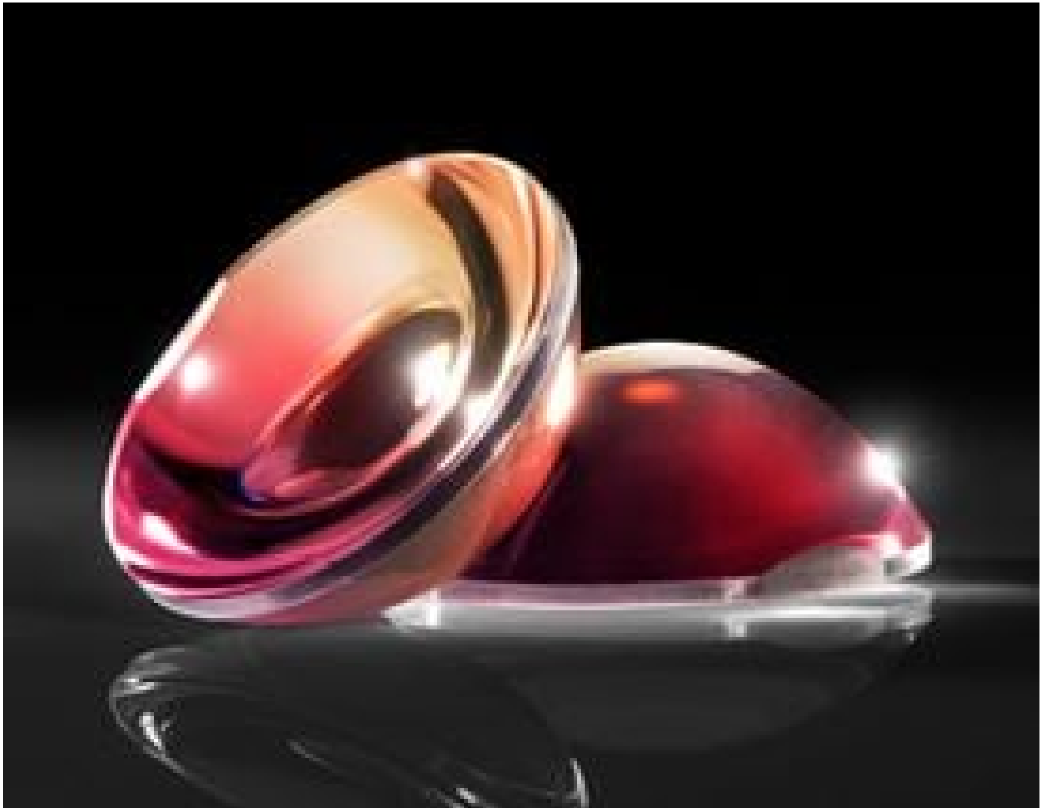
TECHSPEC® Plastic Aspheric Lenses