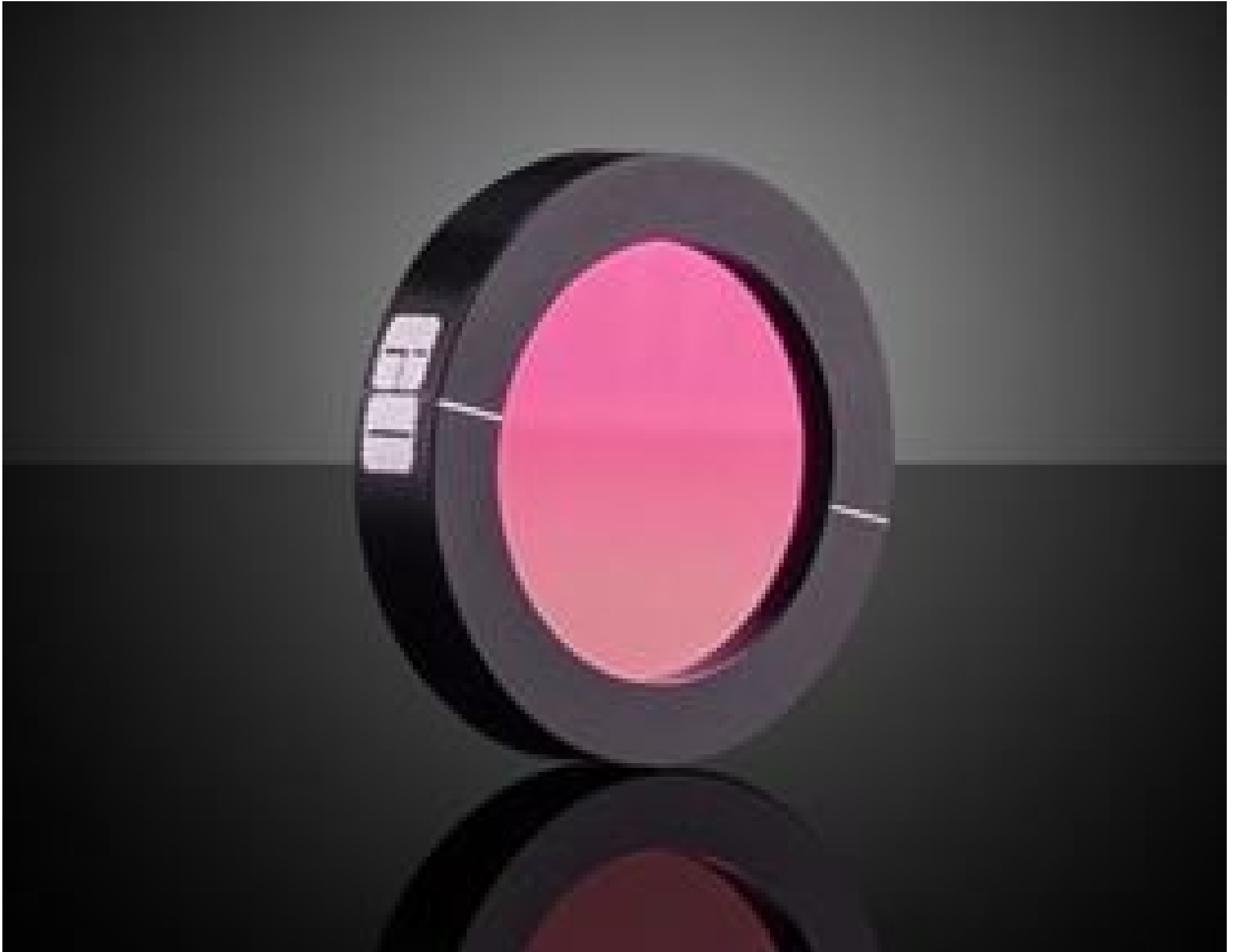
25mm Dia. ZnSe, IR Holographic Wire Grid Polarizer, #62-772