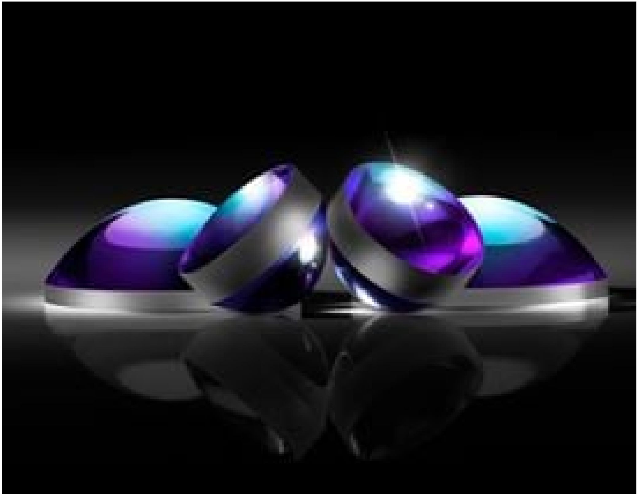
TECHSPEC® Calcium Fluoride (CaF 2 ) Aspheric Lenses