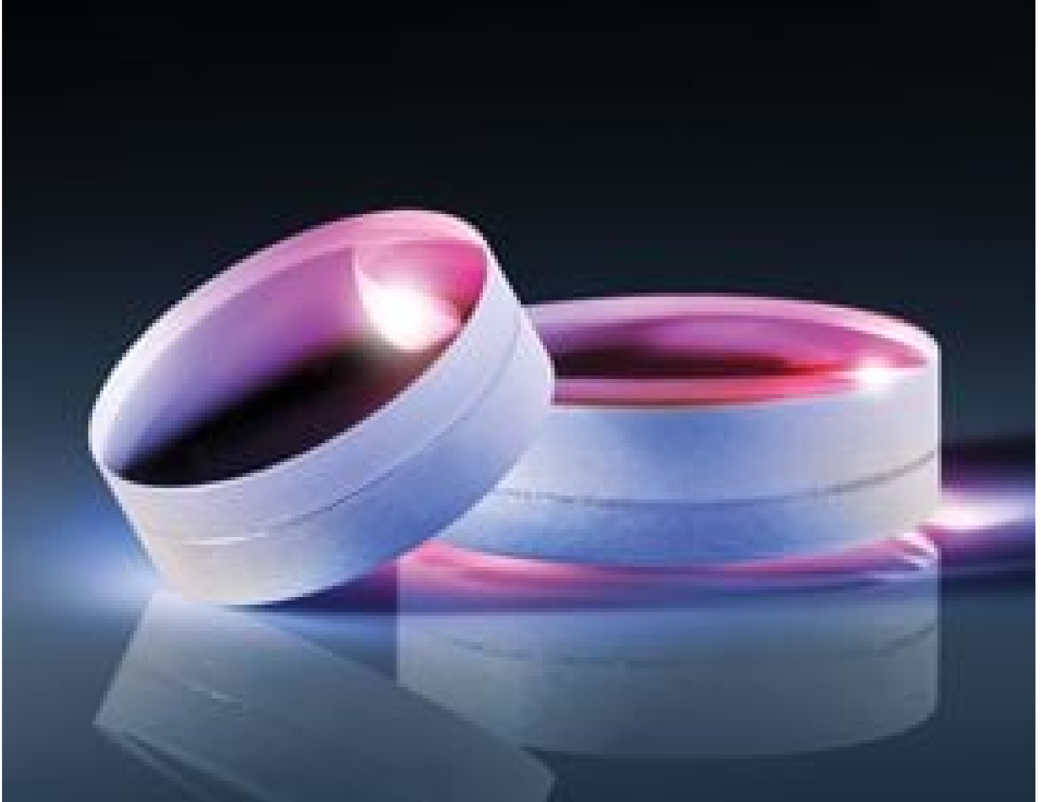
MgF 2 Coated Achromatic Lenses