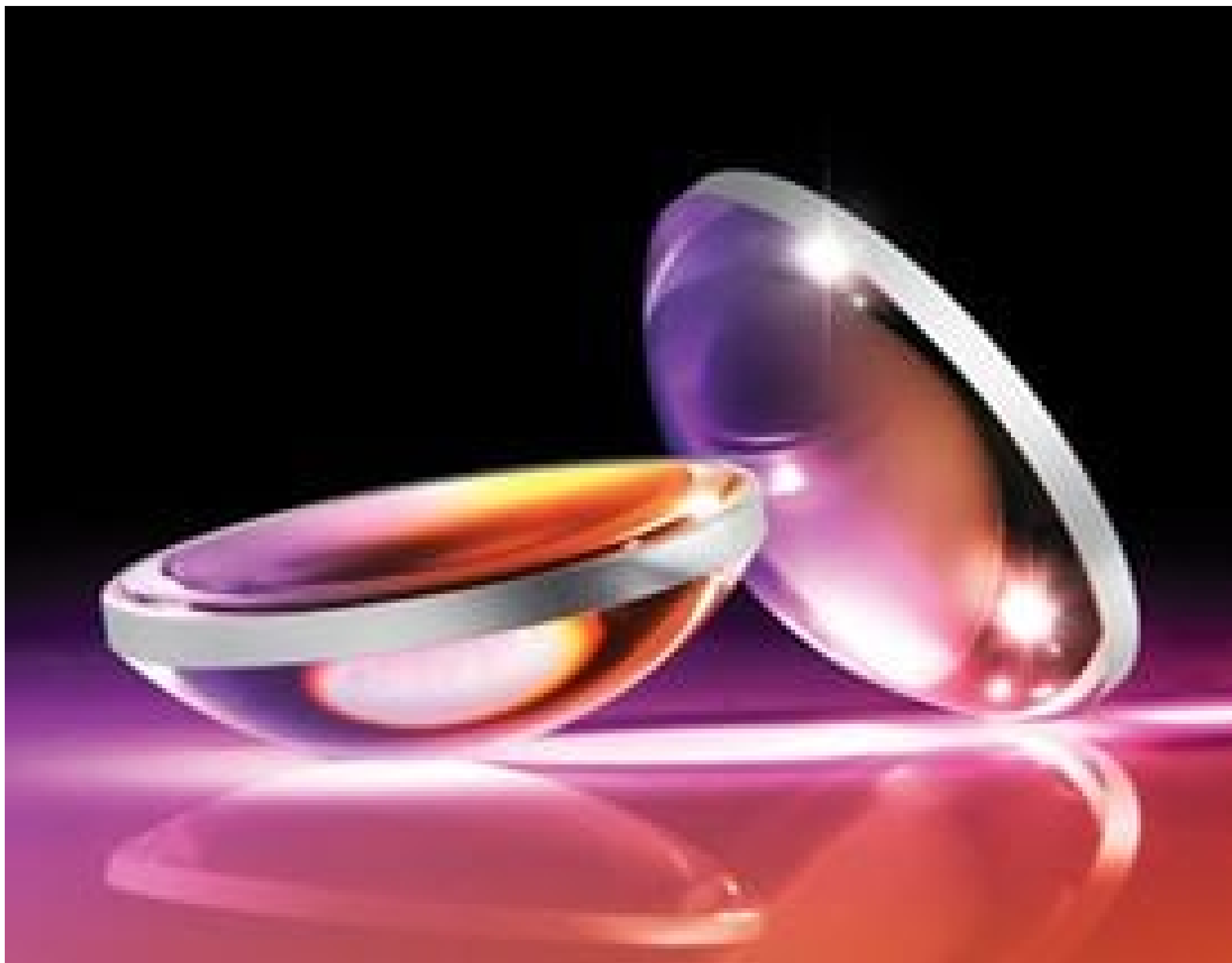
Hyperbolic Aspheric Lenses