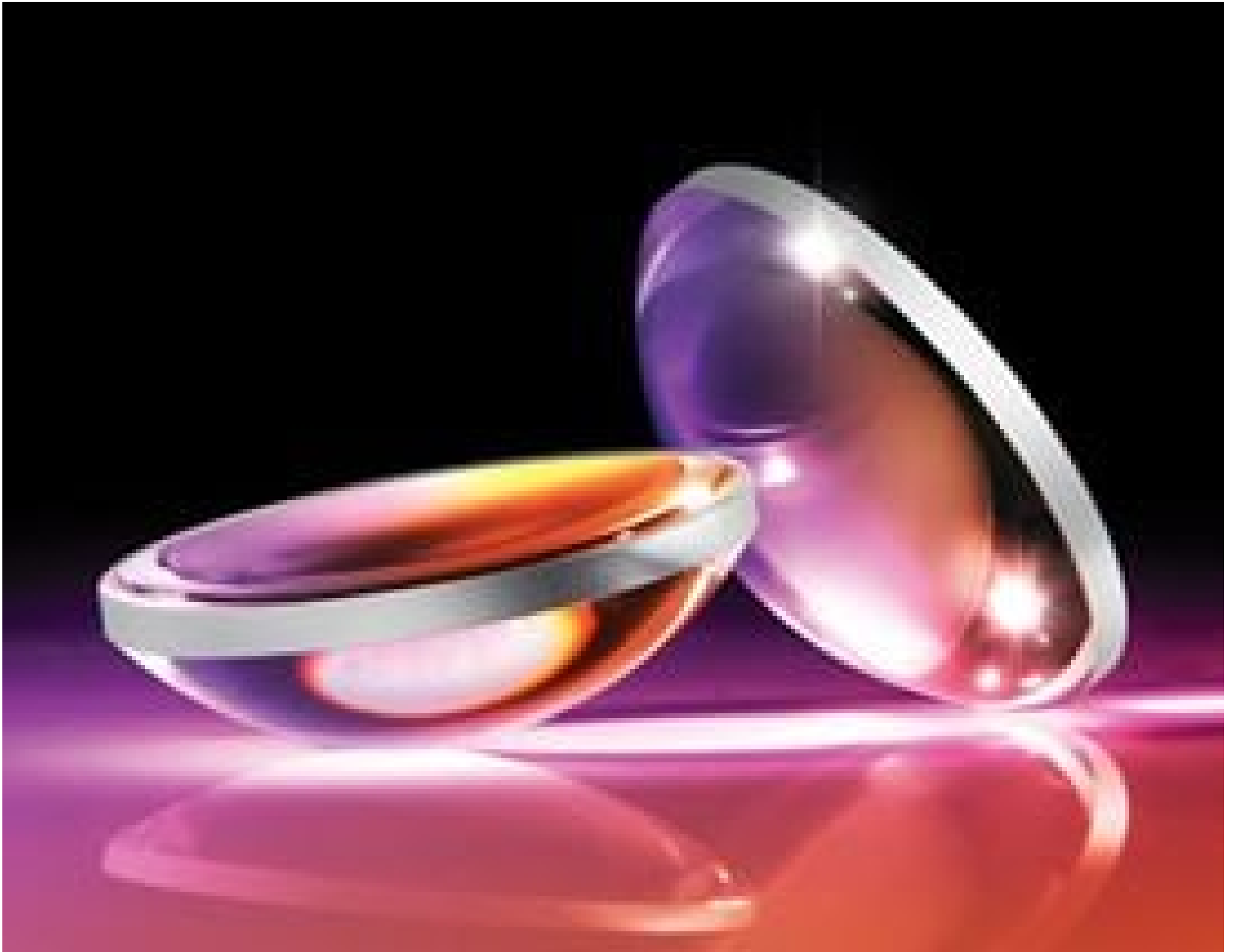
Hyperbolic Aspheric Lenses