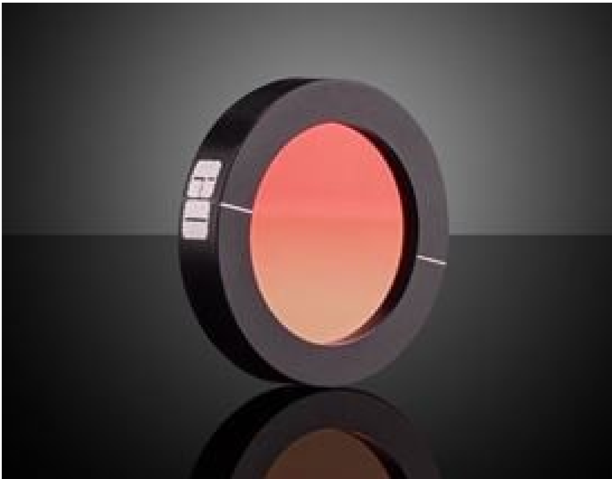
25mm Dia. Ge, IR Holographic Wire Grid Polarizer, #62-776