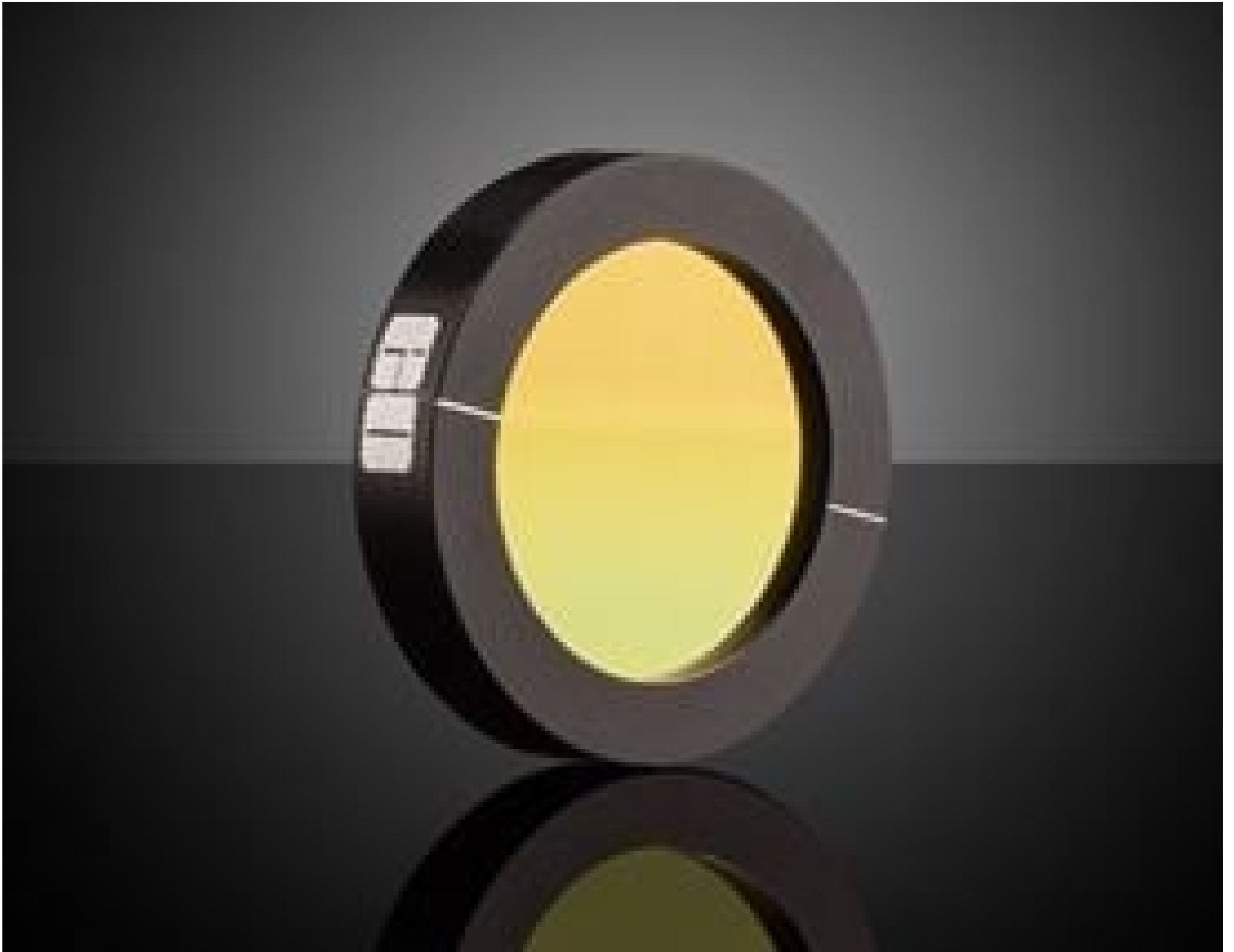
25mm Dia. BaF 2 IR Holographic Wire Grid Polarizer, #62-770