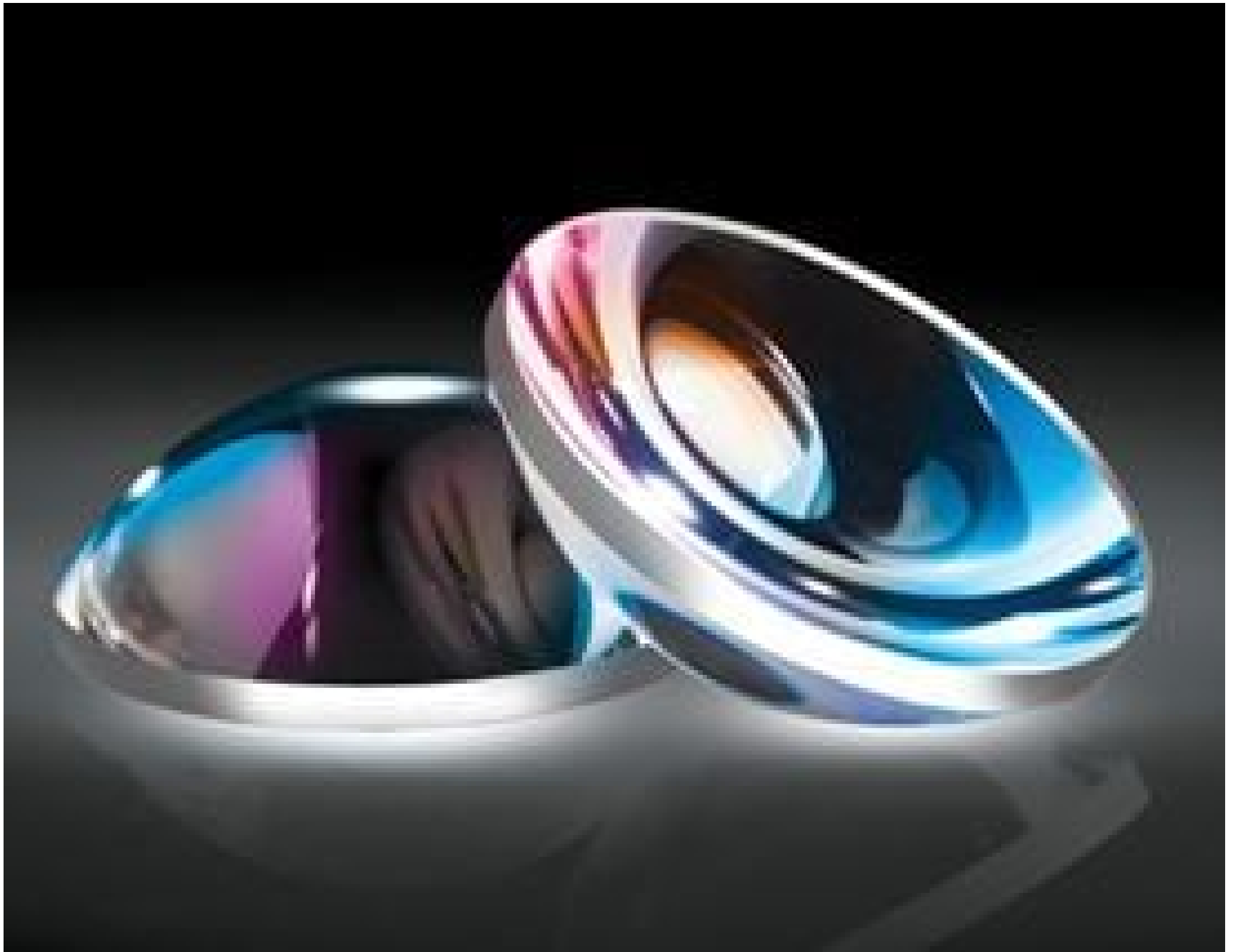
Calibration Grade Aspheric Lenses