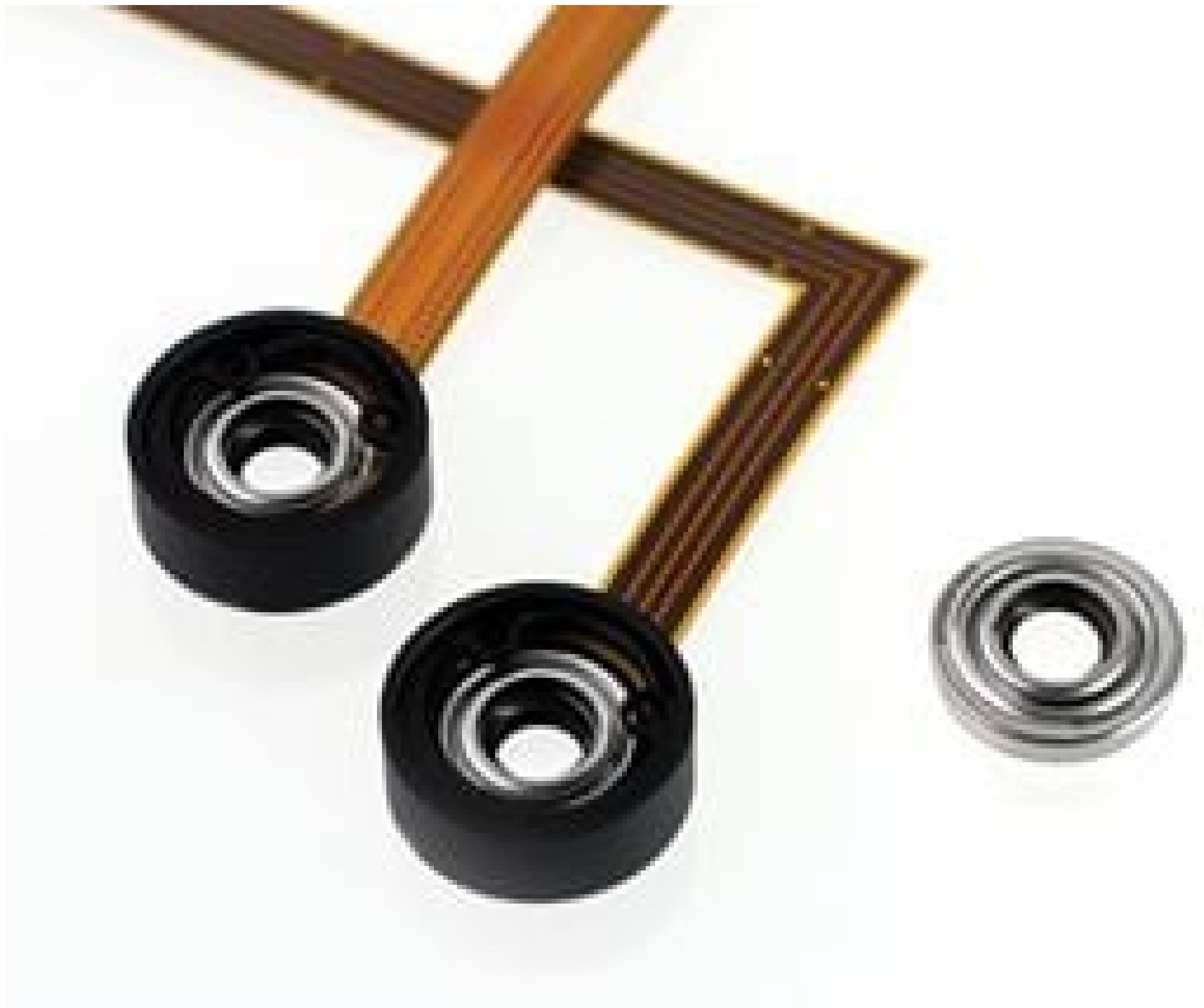
Corning® Varioptic® Variable Focus Liquid Lenses