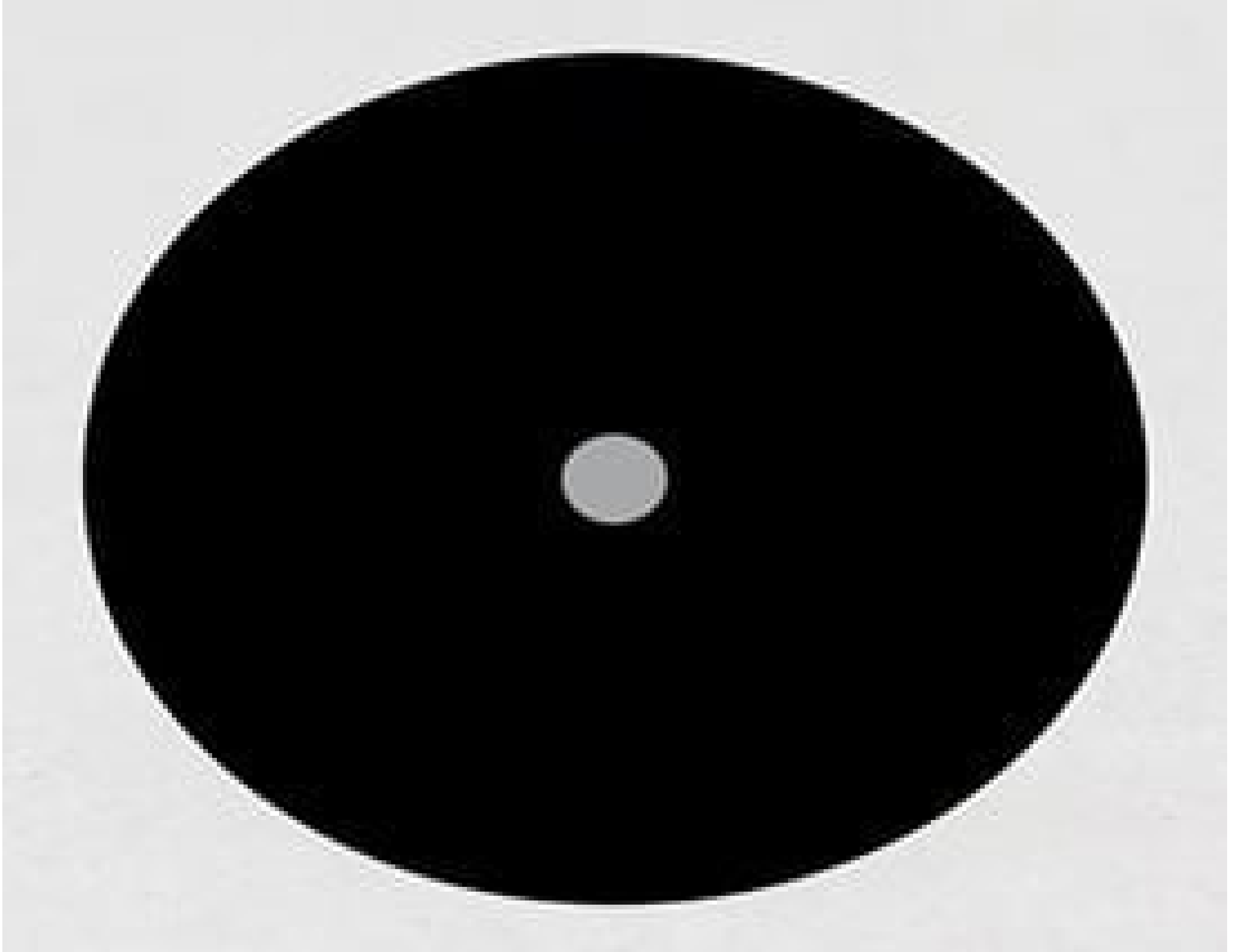
Acktar Blackened Pinholes (unmounted)