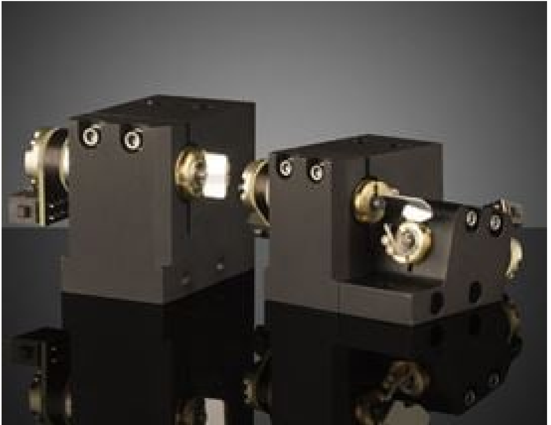
ScannerMAX Saturn Galvanometer Optical Scanners