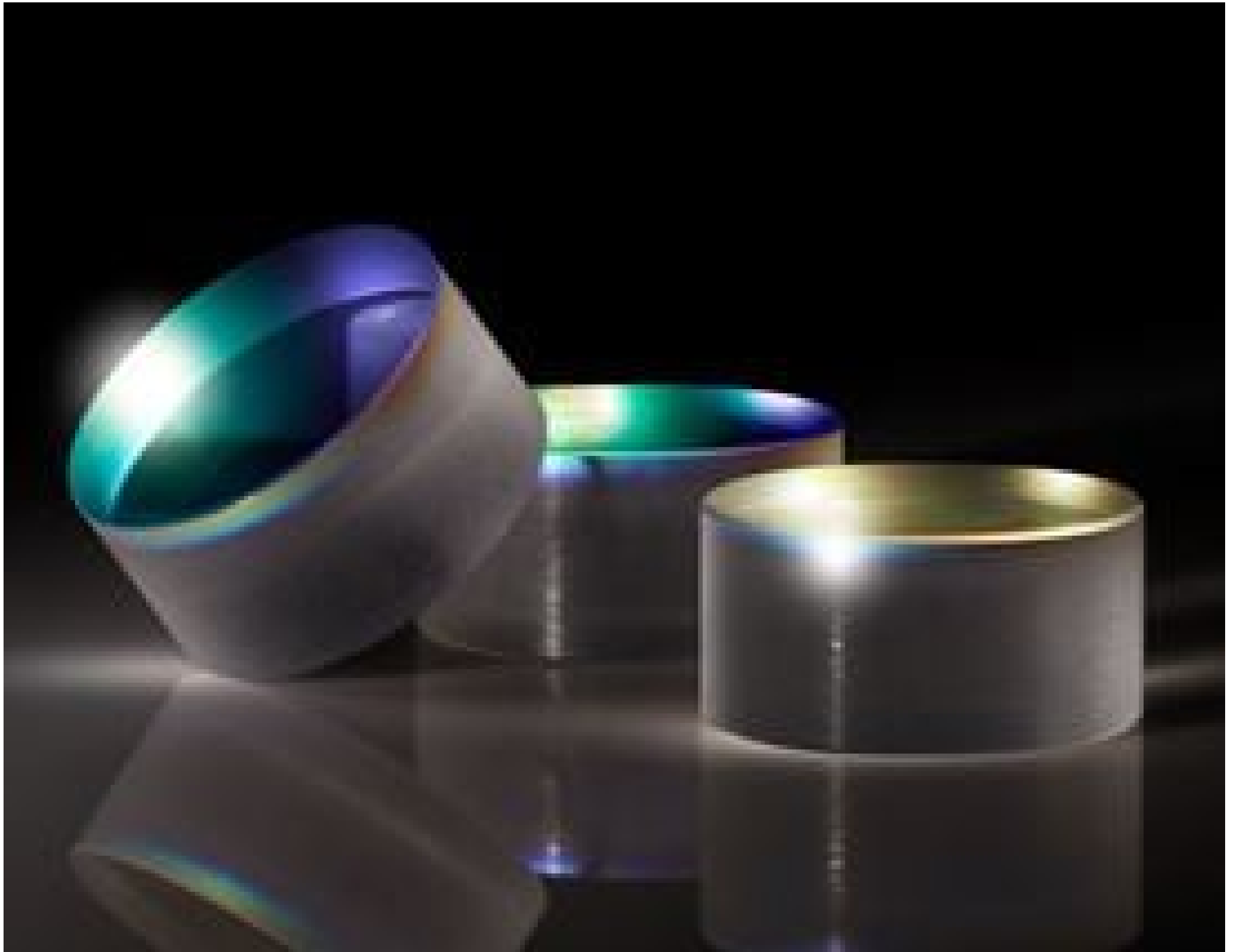
UltraFast Innovations (UFI) High-Power Low-Loss Laser Mirrors