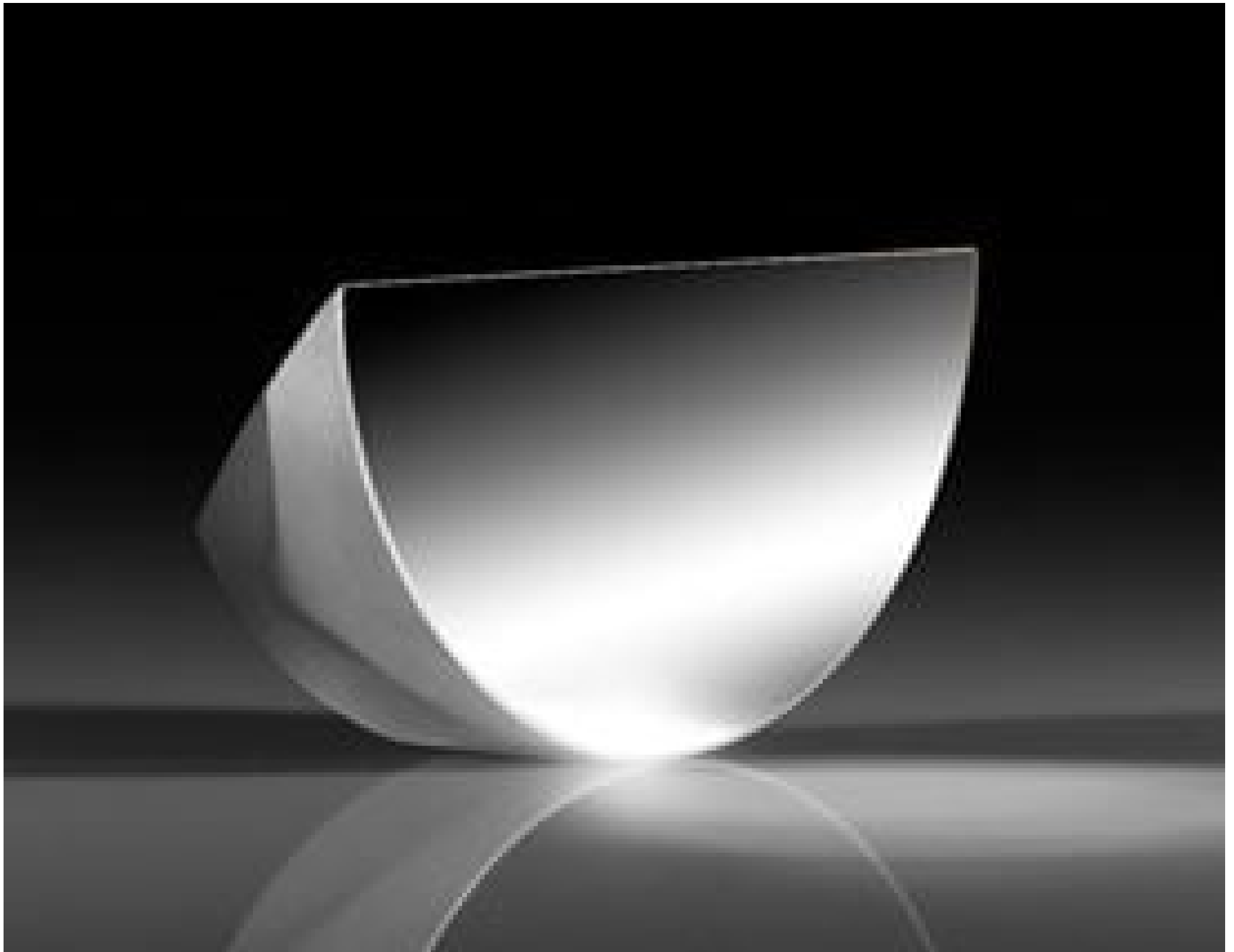
25.4mm Enhanced Protected Silver \lambda/10 D-Shaped Pickoff Mirror, #36-137