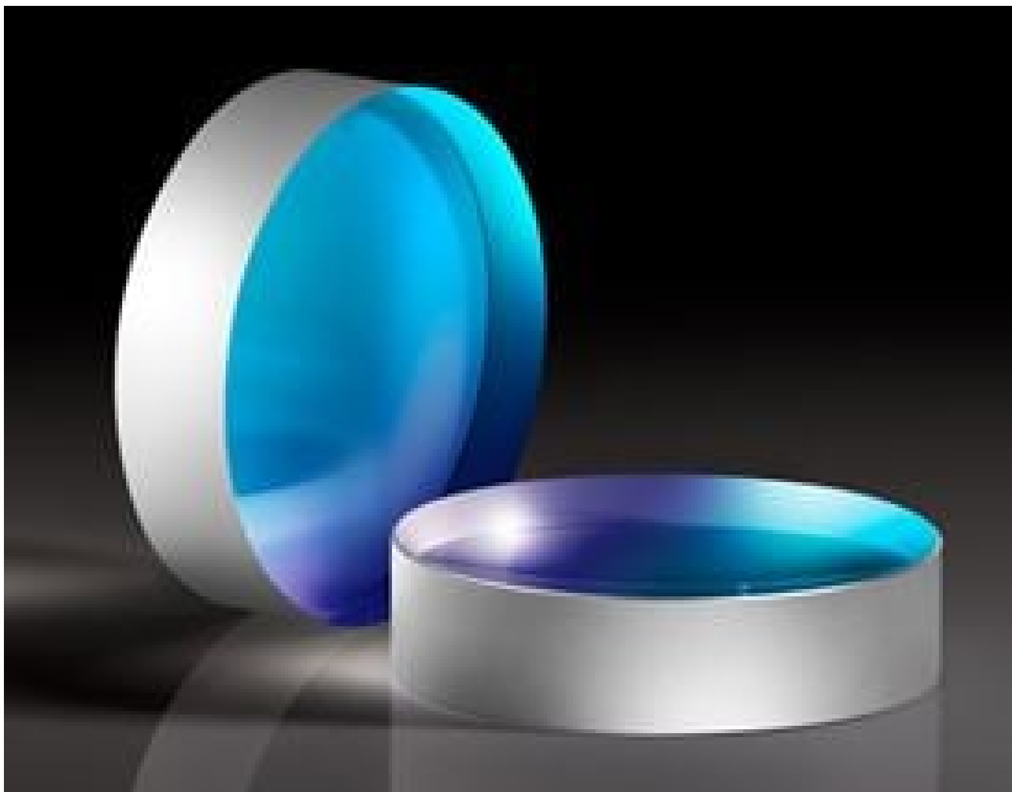
Laser Line Concave Mirrors