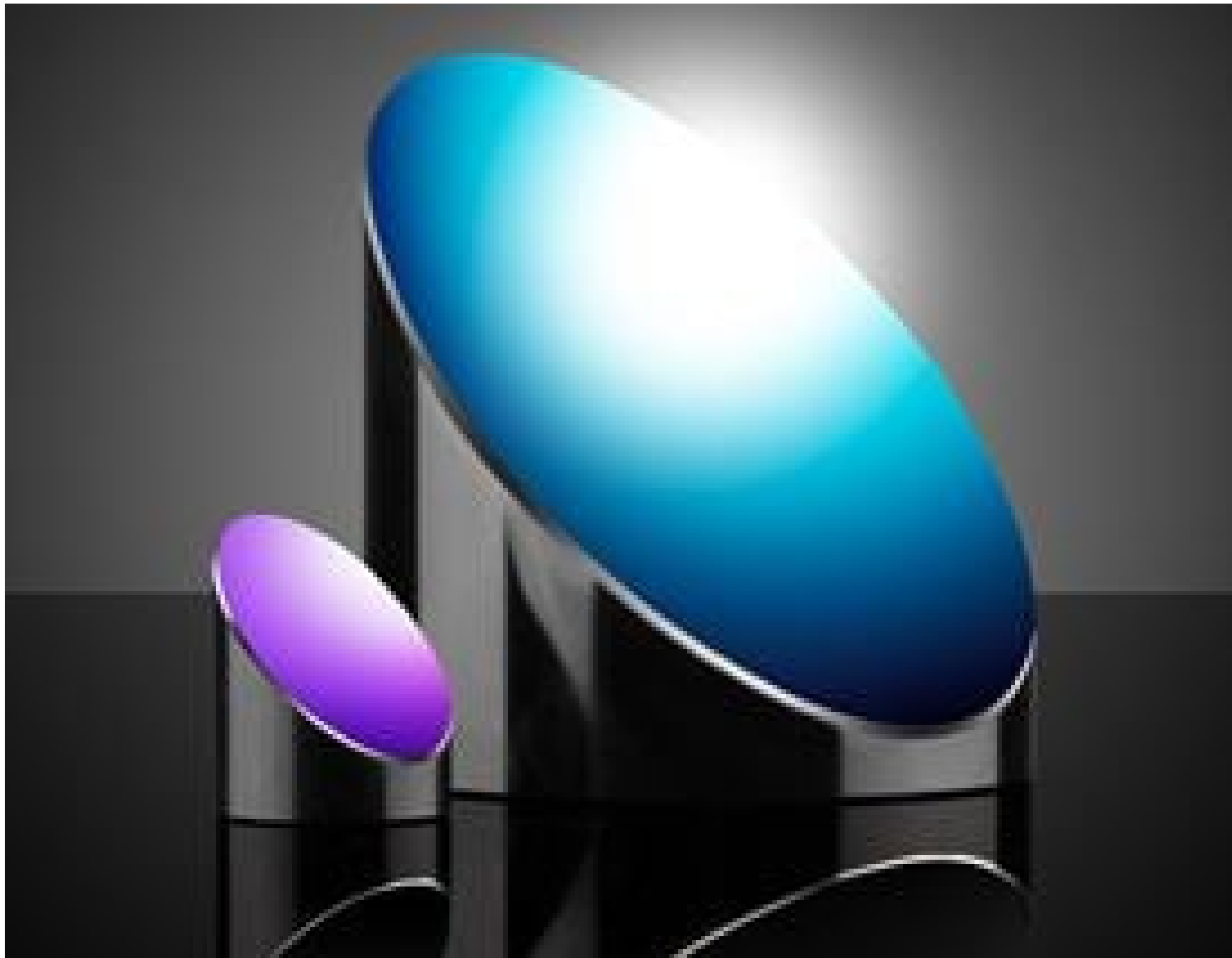
TECHSPEC® Laser Line Coated Off-Axis Parabolic (OAP) Mirrors