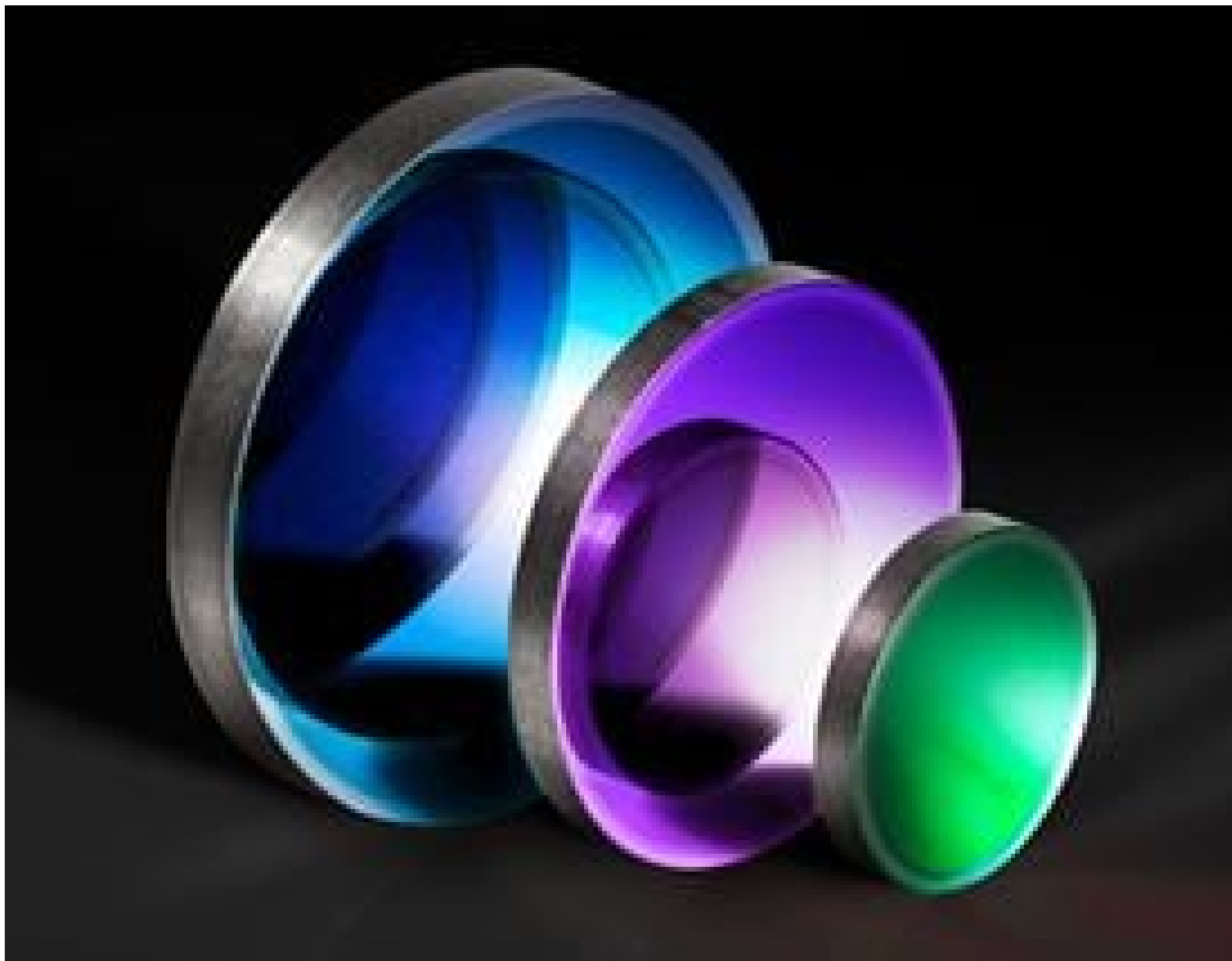
Germanium (Ge) Windows