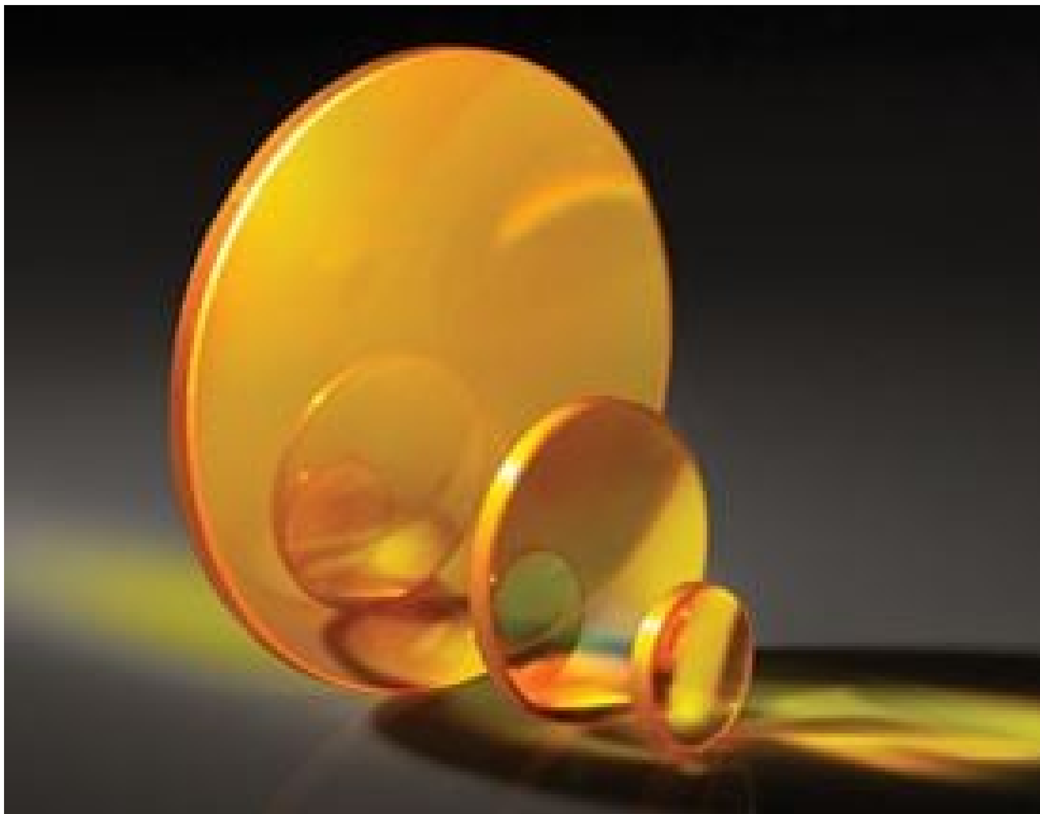
TECHSPEC Zinc Selenide (ZnSe) Plano-Convex (PCX) Lenses