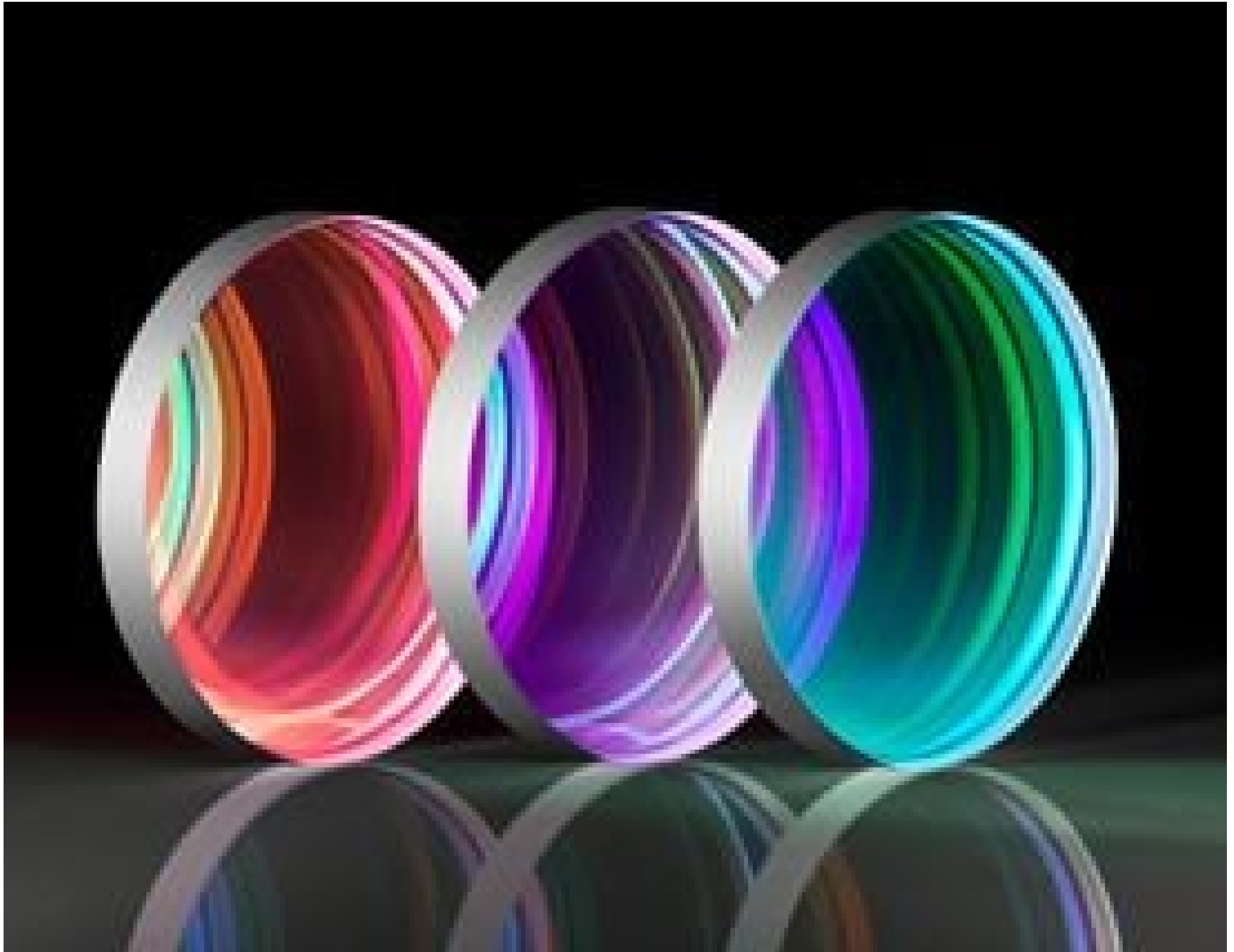
Ultrafast Harmonic Separators