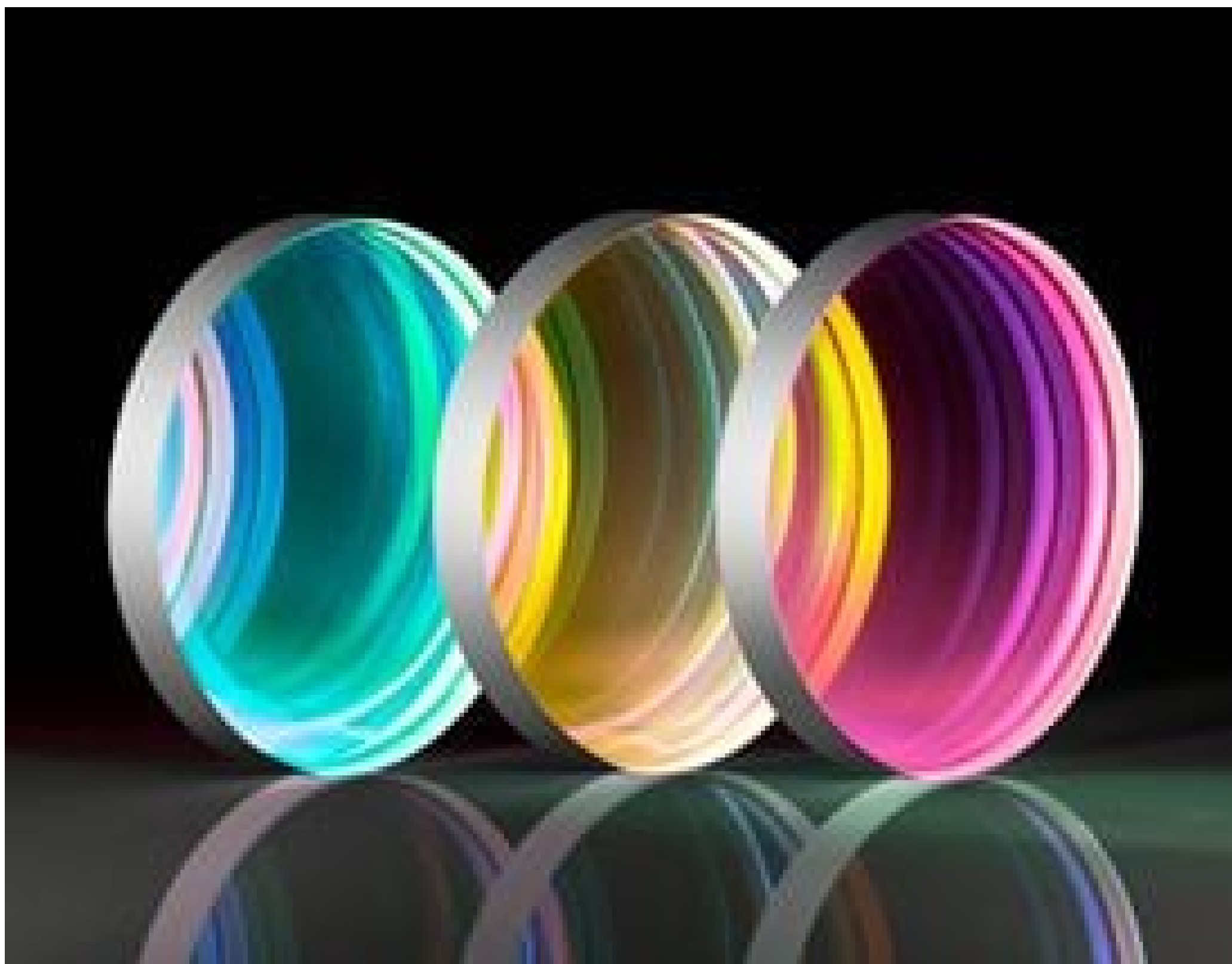
TECHSPEC® Ultrafast Beamsplitters