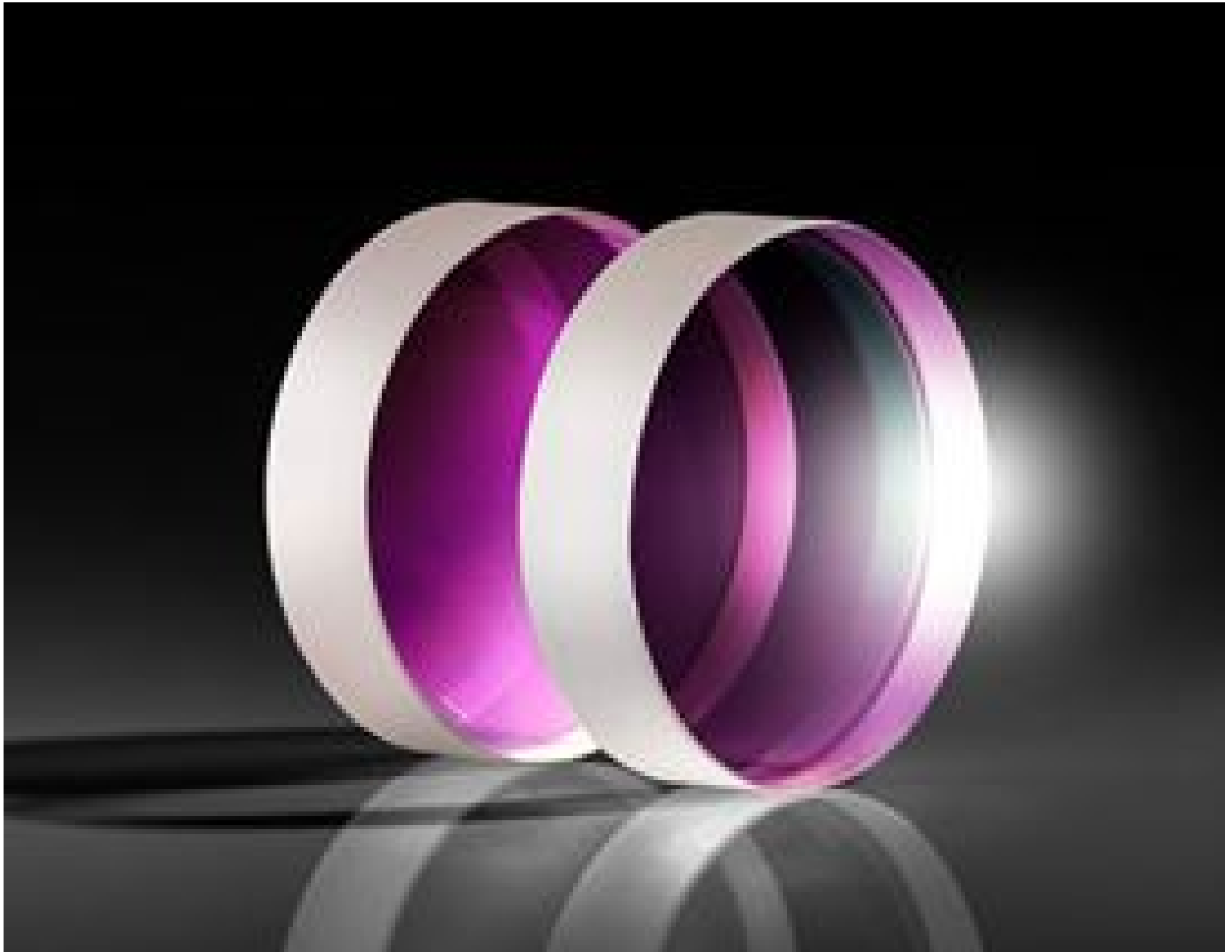
UltraFast Innovations (UFI) Ultra-Broadband Complementary Chirped Mirror Pairs