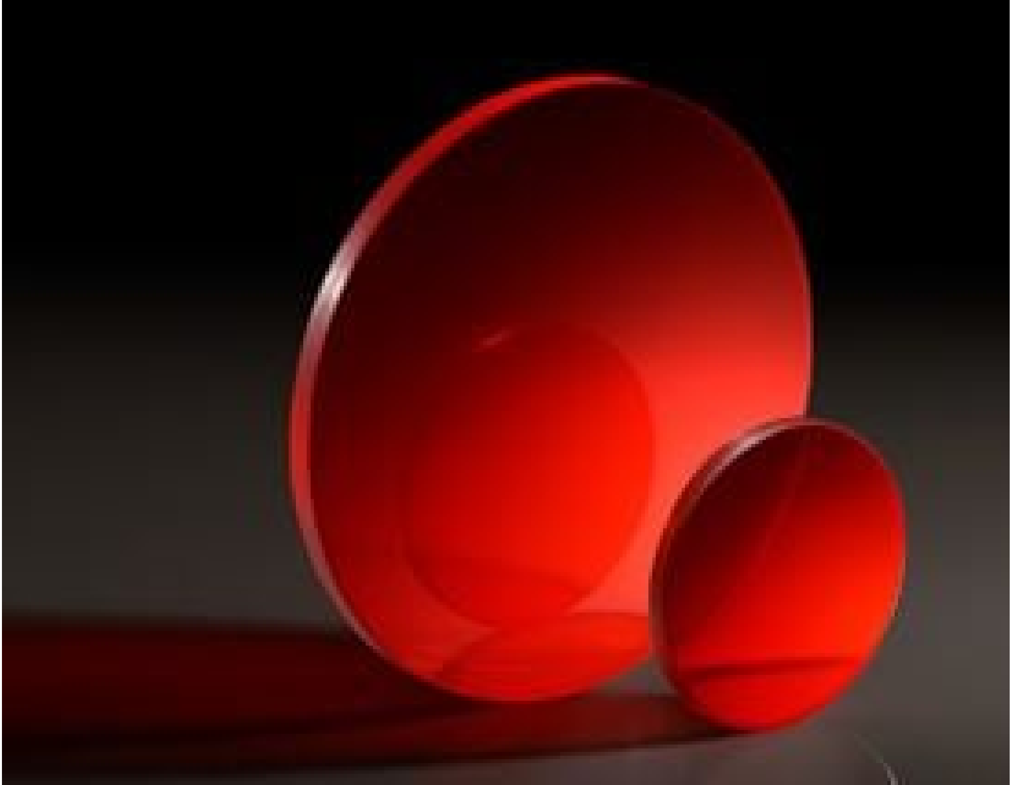
Thallium Bromoiodide (KRS-5) Windows