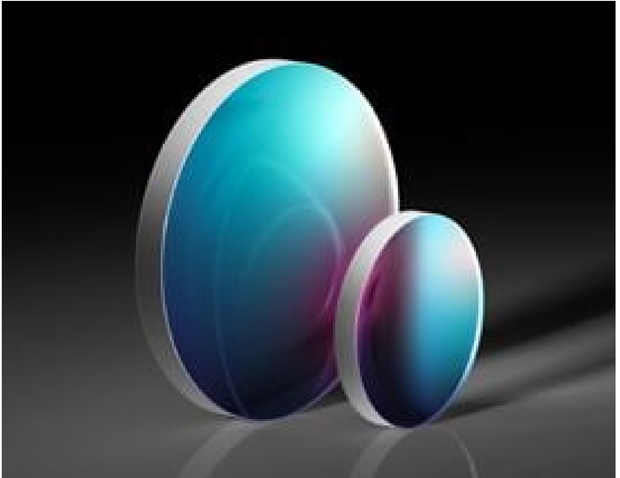
TECHSPEC® Thin Nd:YAG Laser Line Beam Samplers