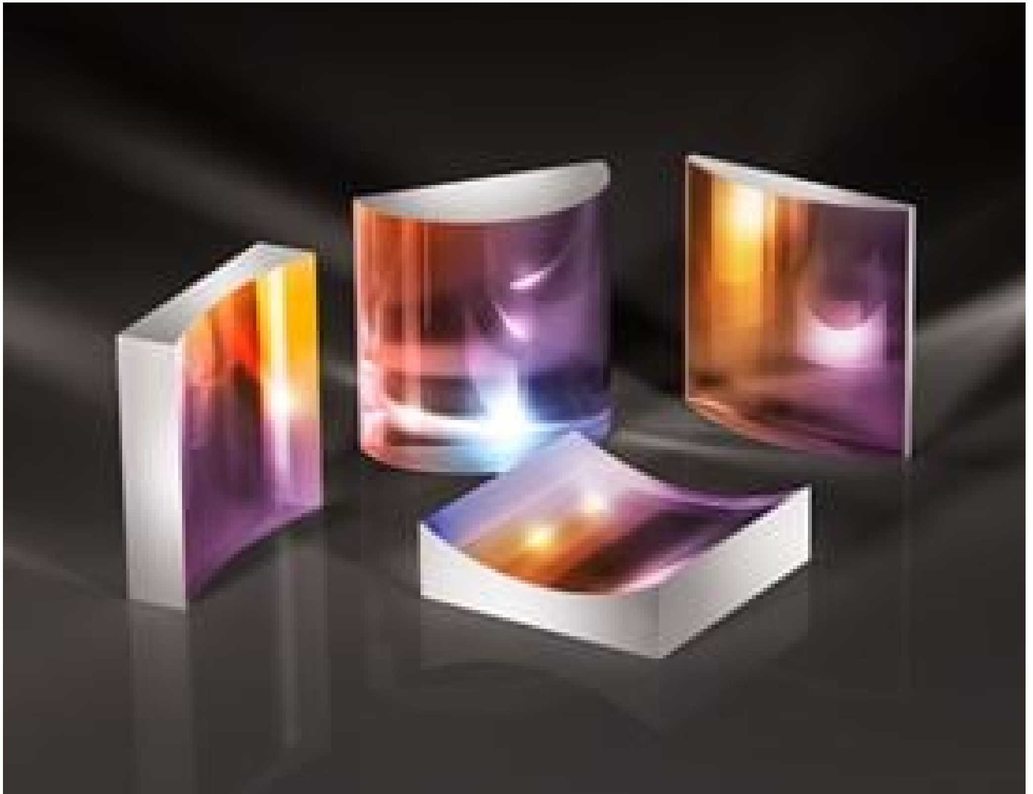
TECHSPEC Beam Shaping Fused Silica Cylinder Lenses