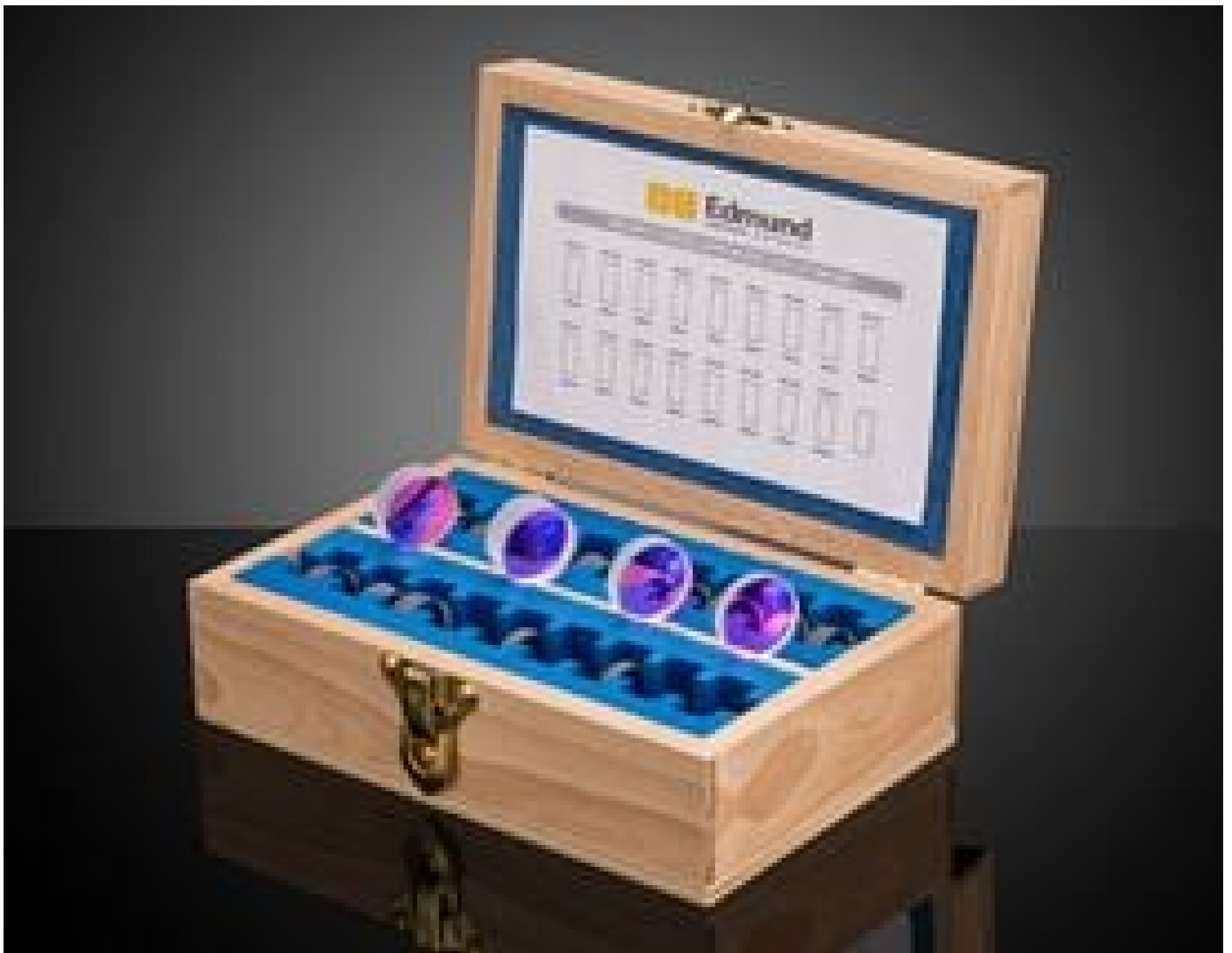
Achromatic Lens Kit