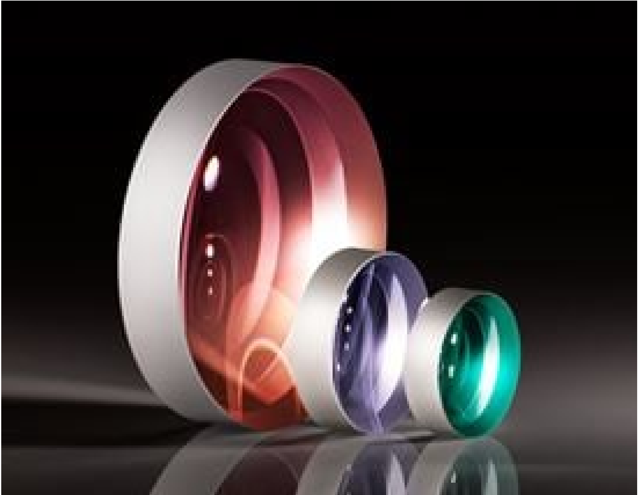
TECHSPEC Uncoated Plano-Concave (PCV) Lenses