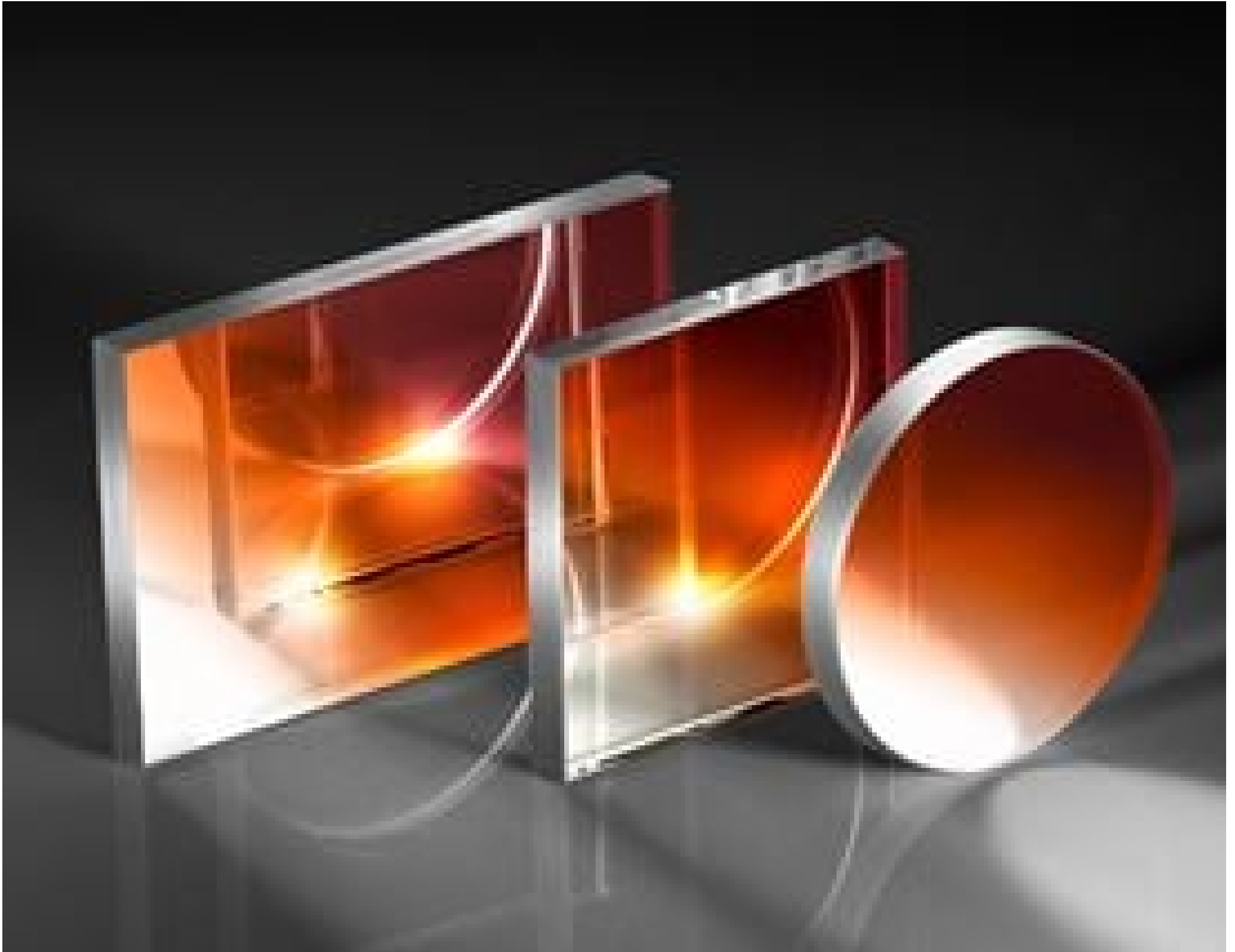
Visible and NIR Plate Beamsplitters