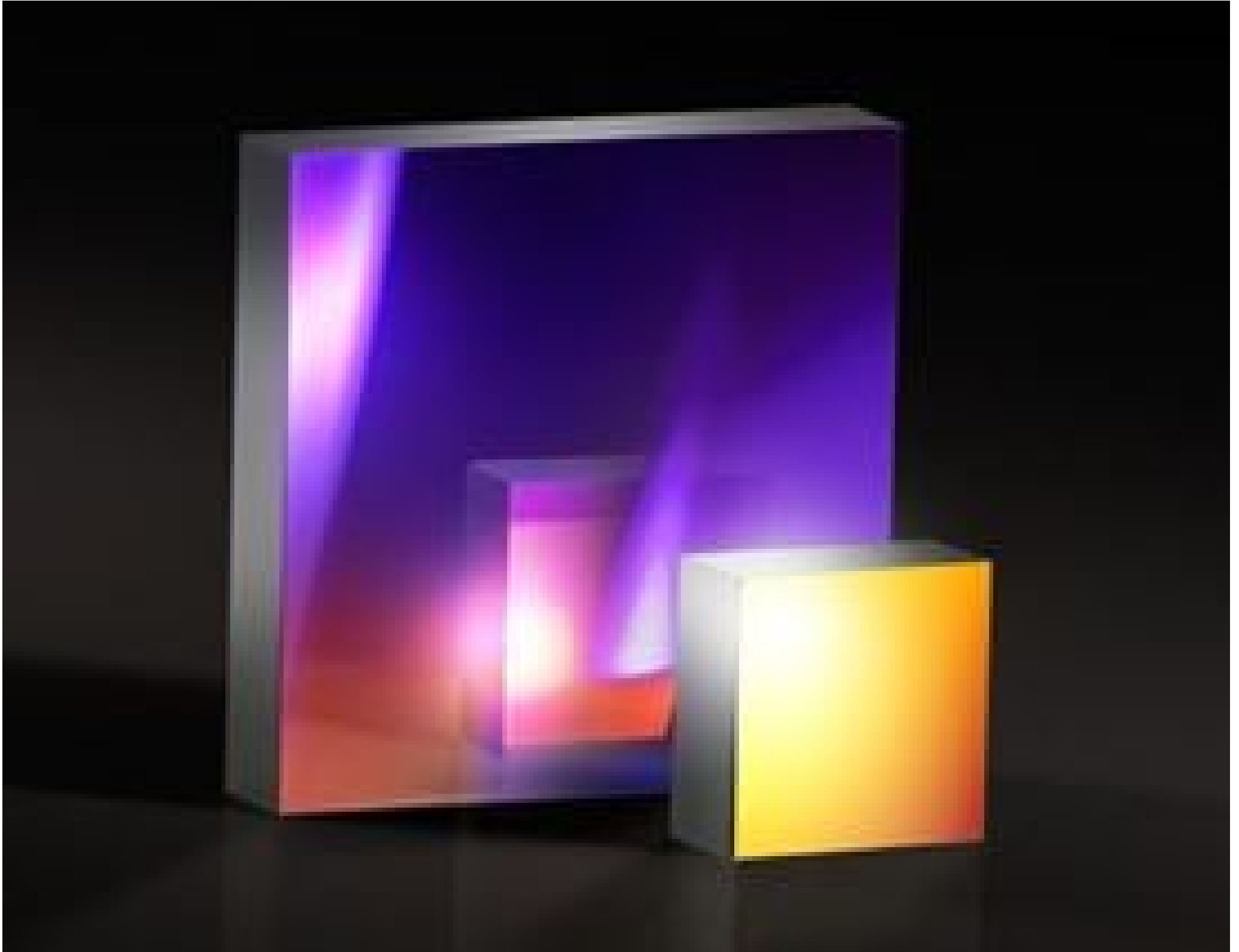
Richardson Gratings™ High Precision Reflective Holographic Diffraction Gratings