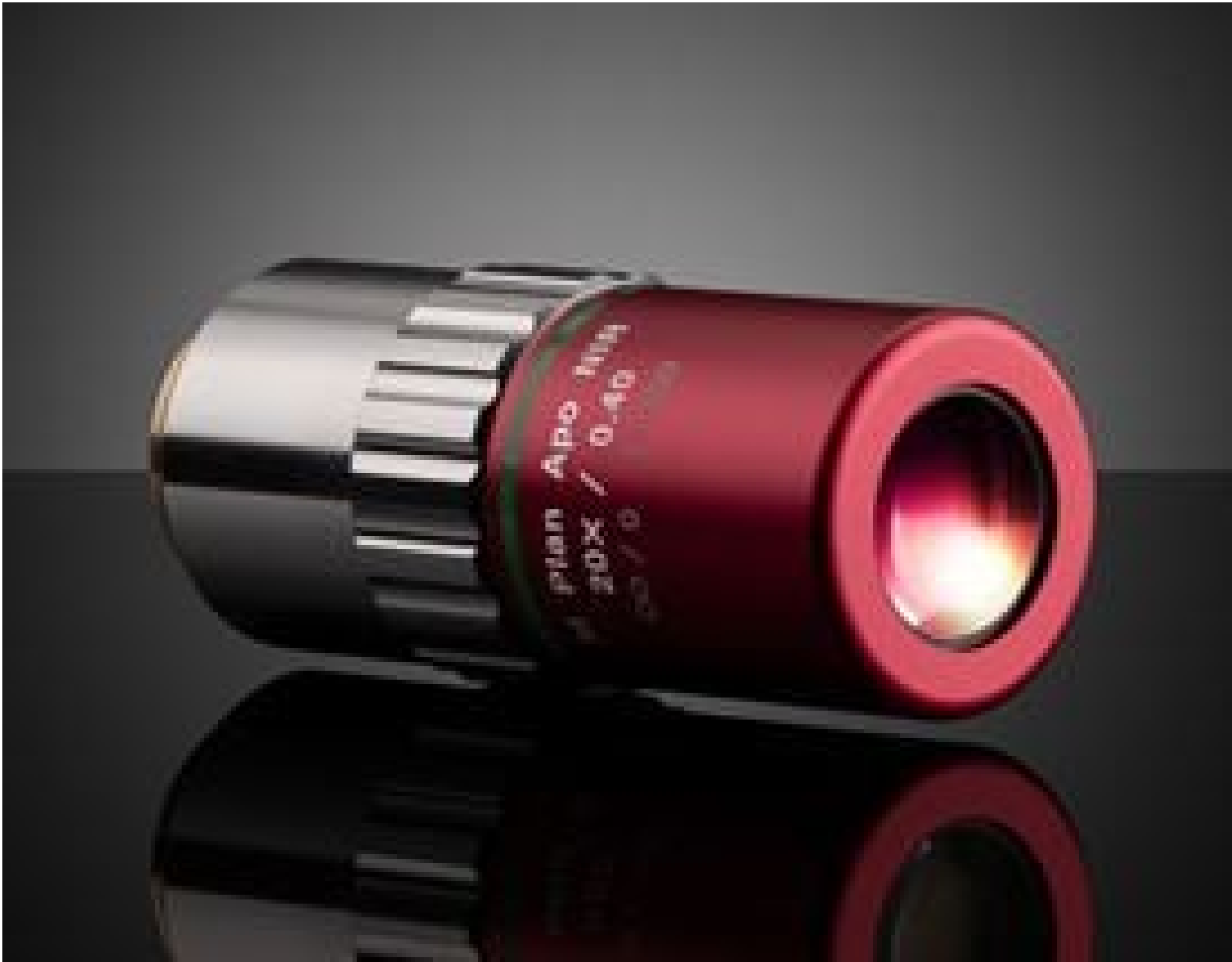
20X Mitutoyo Plan Apo NIR Infinity Corrected Objective, #46-404