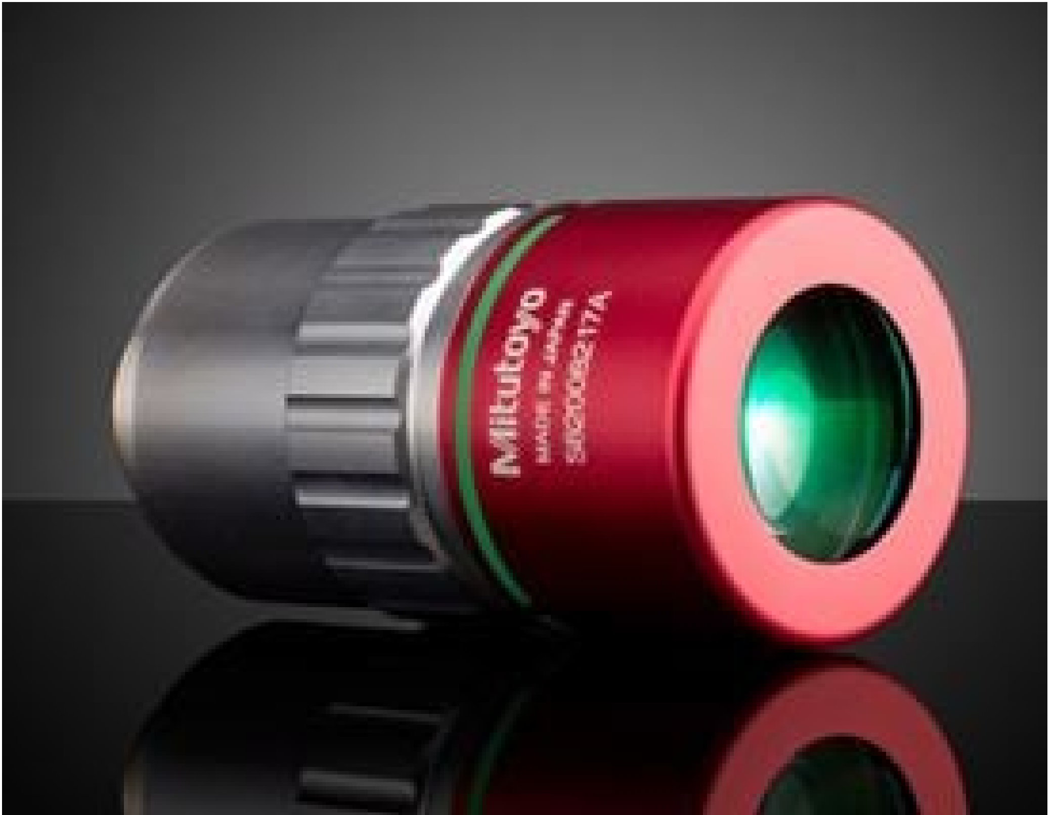
20X Mitutoyo Plan Apo NIR B Infinity Corrected Objective, #89-350