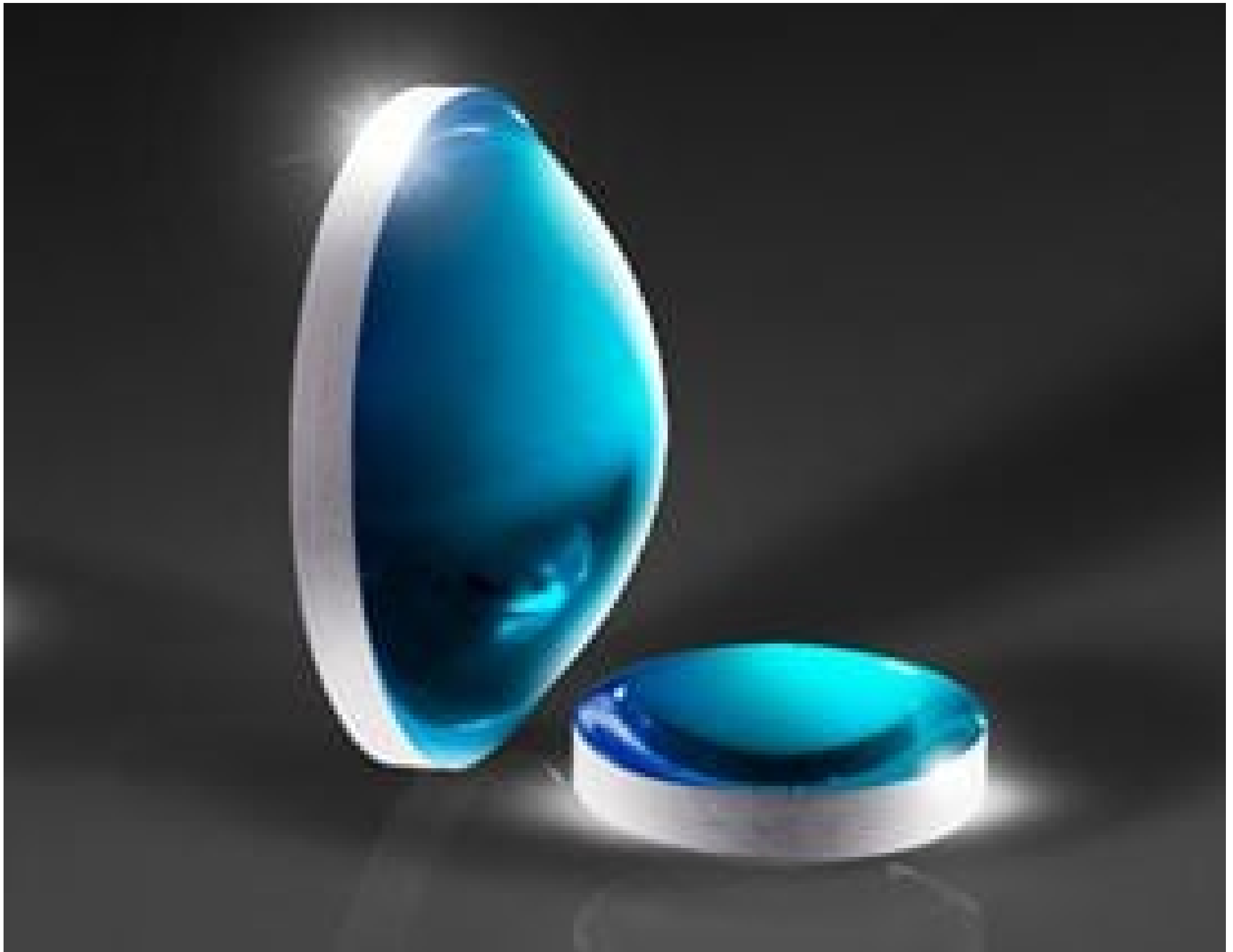
Molded Aspheric Condenser Lenses