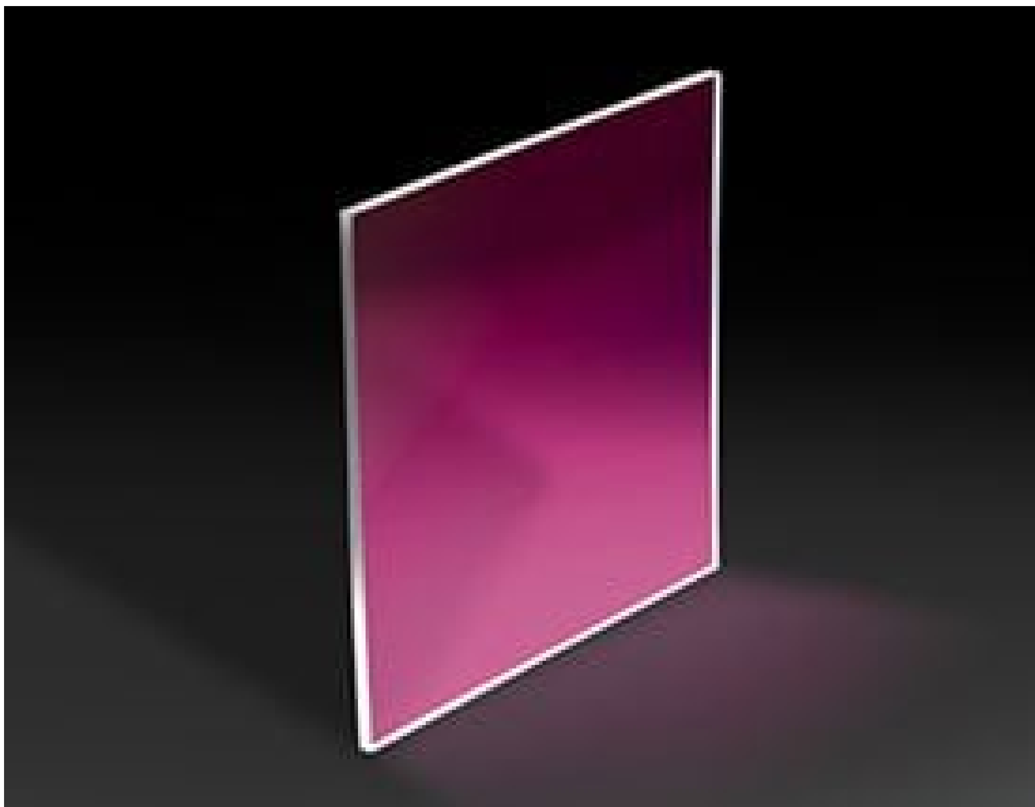
Gorilla® Glass Windows