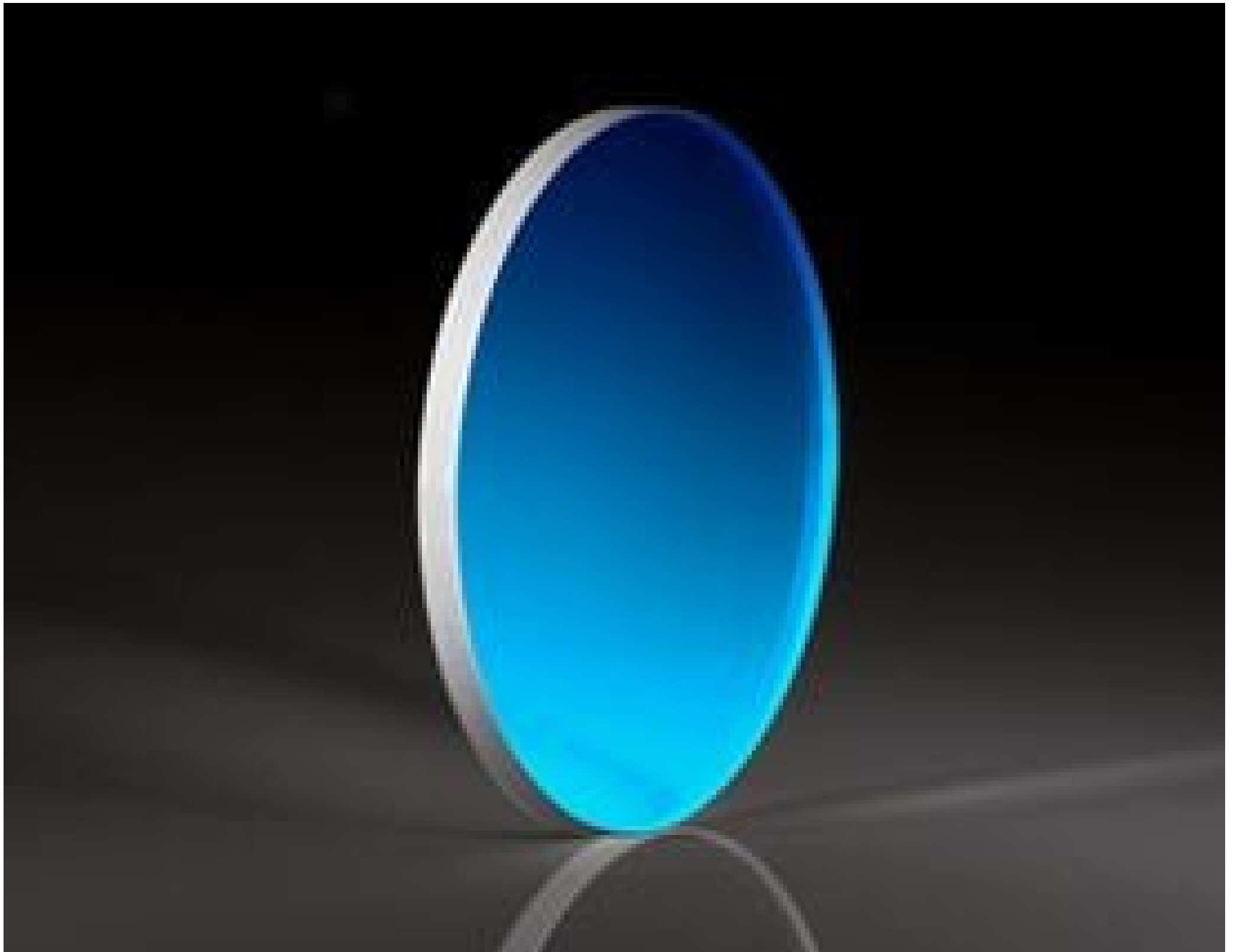
Uncoated \lambda/20 Fused Silica Window