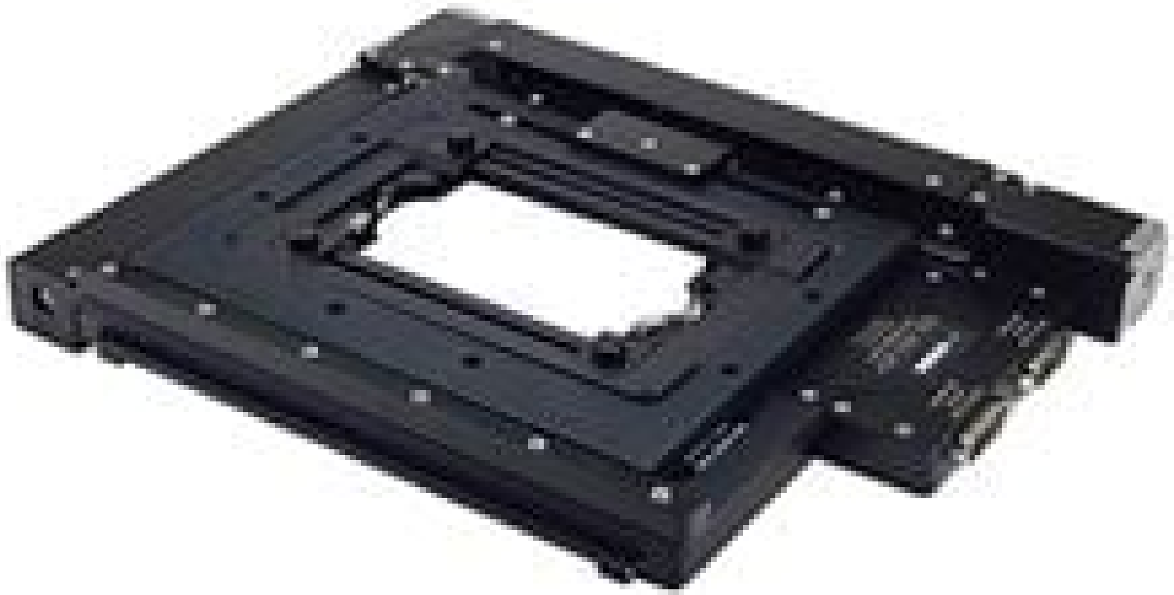
XY Microscope Translation Stage