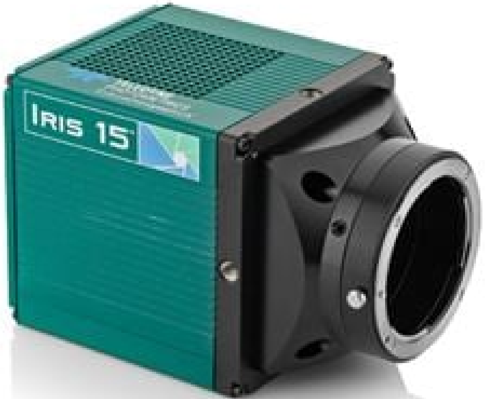
#90-391 Photometrics Iris 15 PCIe Camera