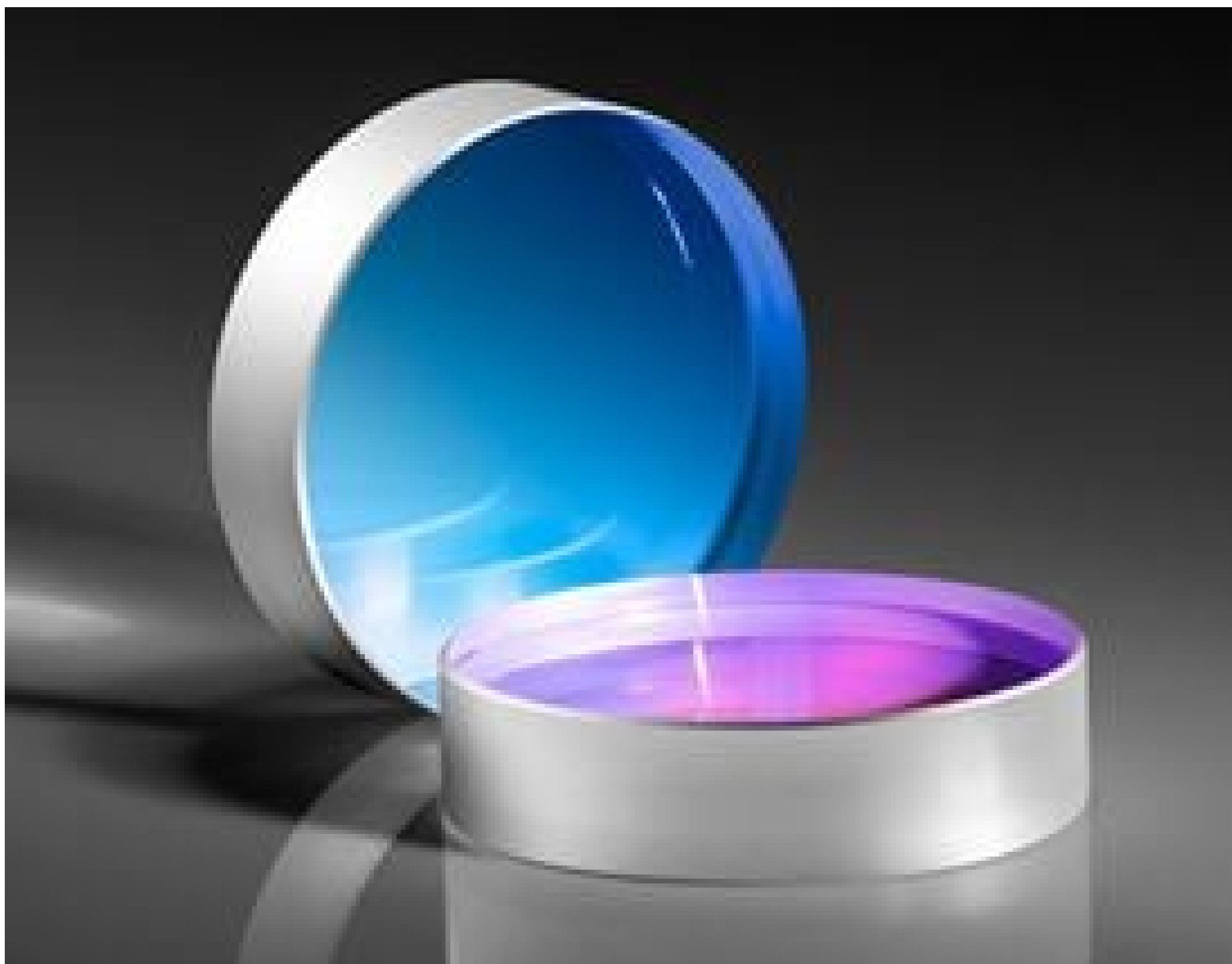
TECHSPEC® Nd:YAG Laser Line Beam Samplers