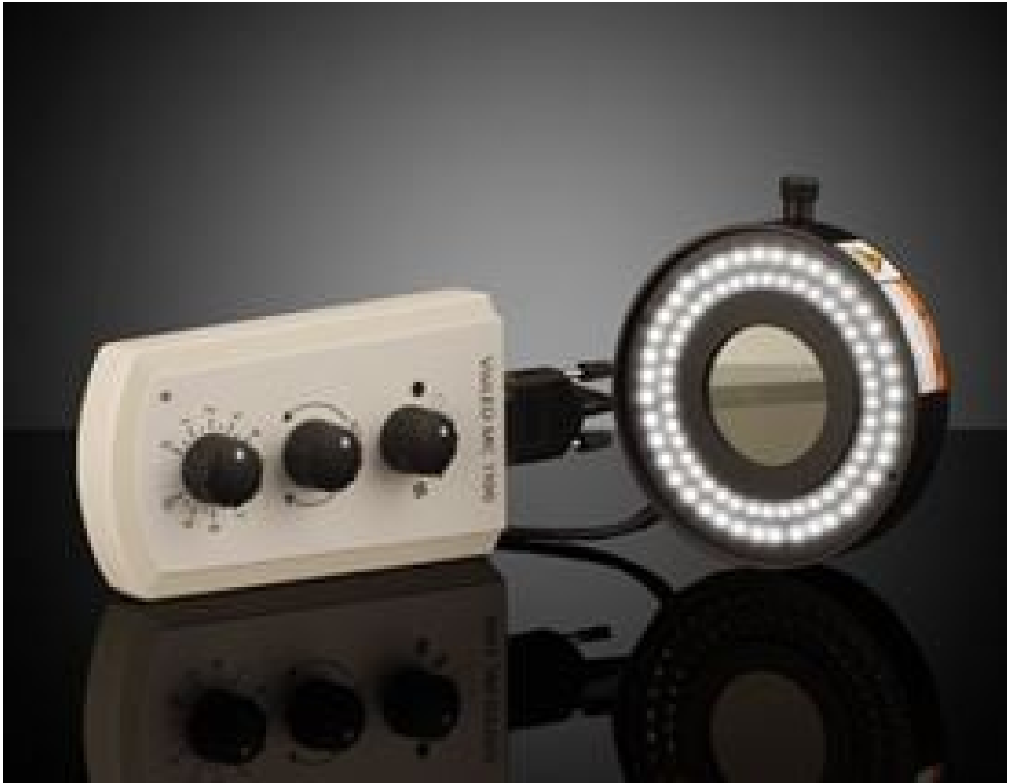
Anneau Lumineux, Contrôleur et Alimentation nécessaires et vendus séparément.