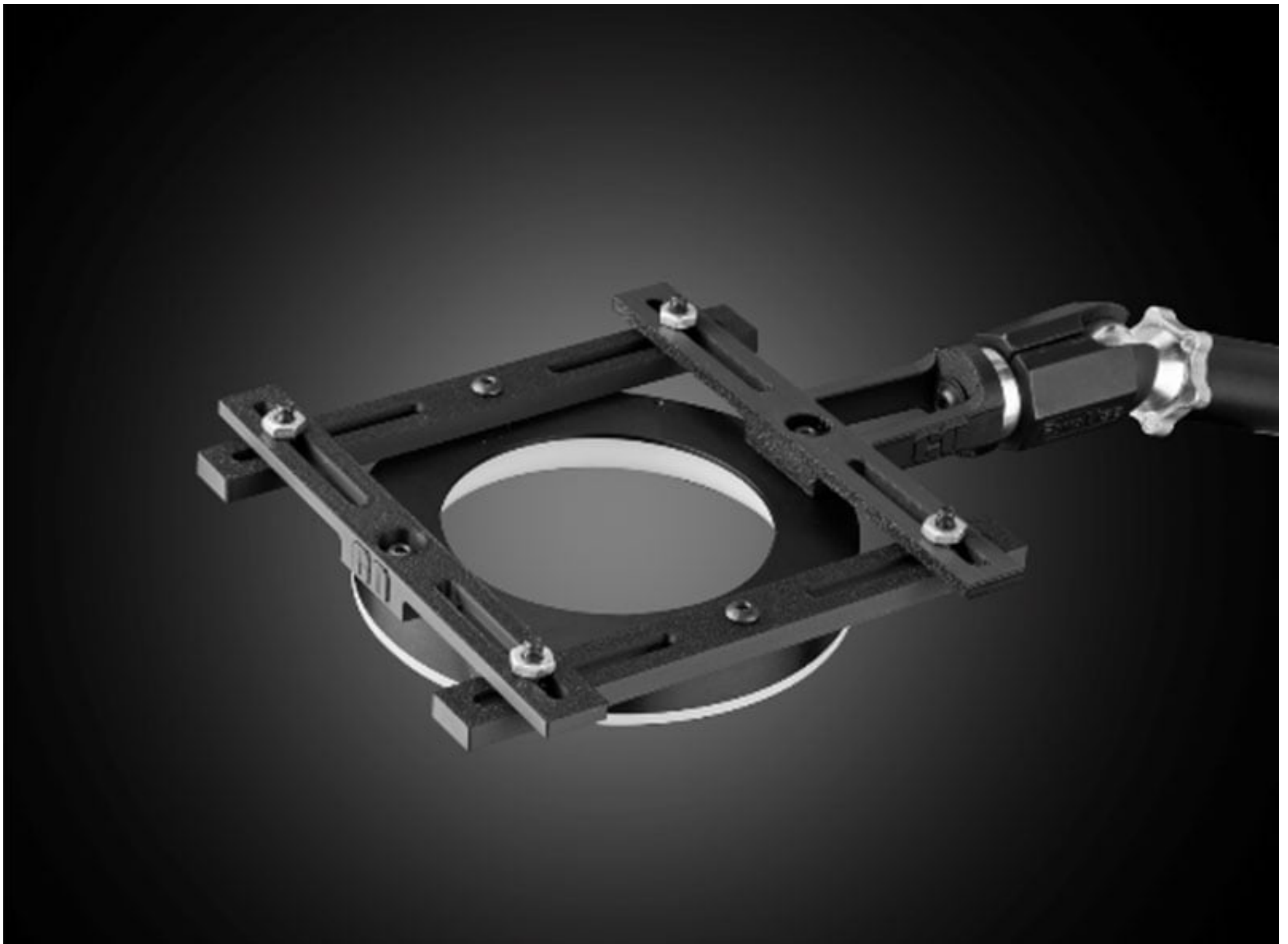
Configuration pour anneaux lumineux