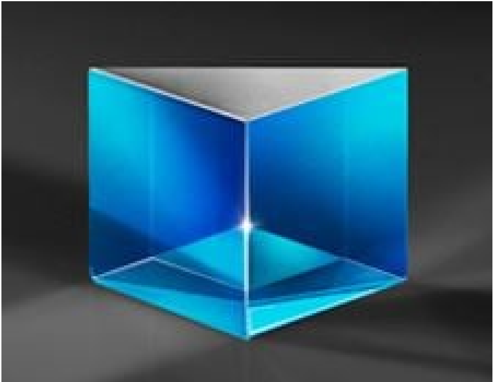
Broadband Anti-Reflection Coated Hypotenuse Prism