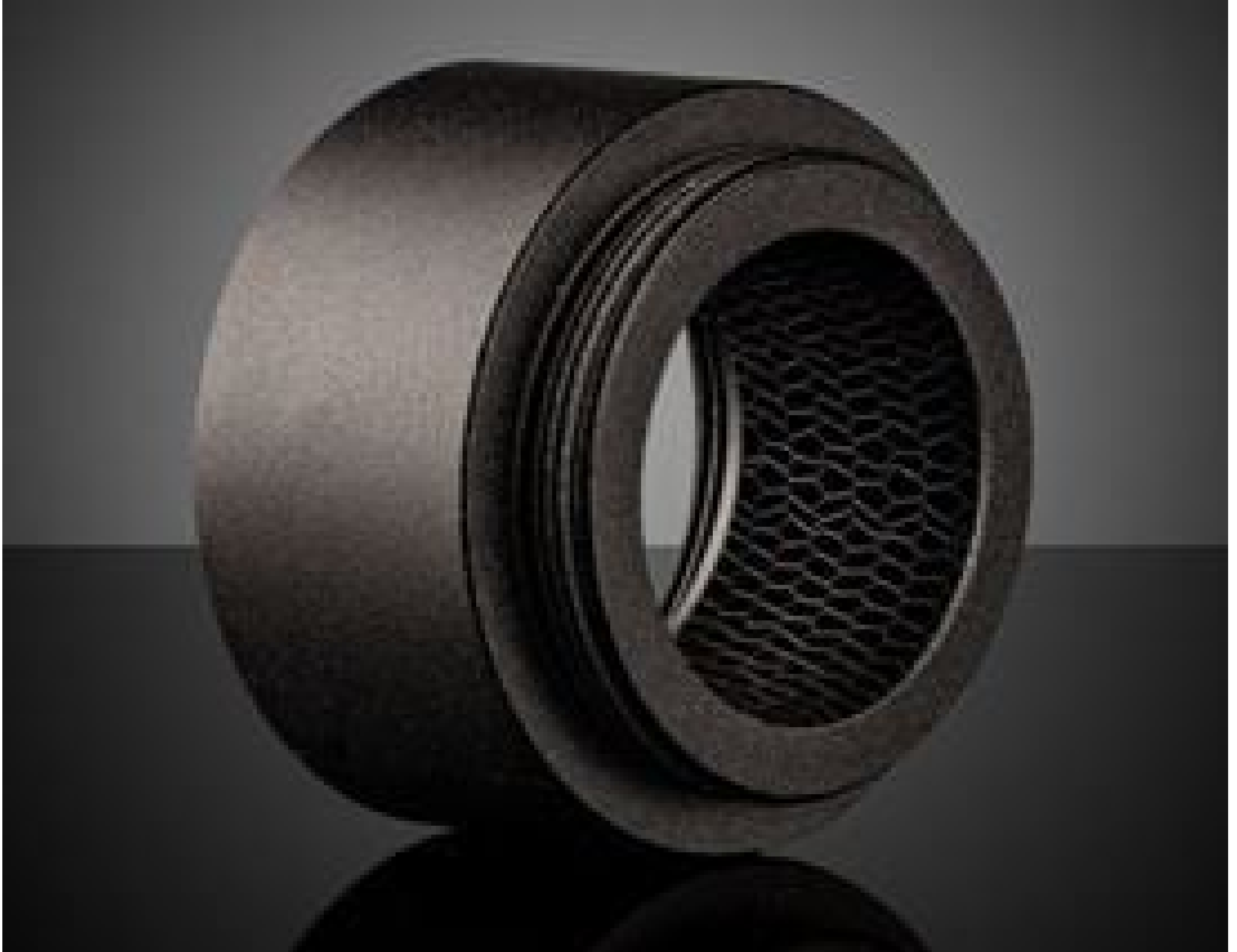
15mm Length, Acktar Hexa-Black™ C-Mount Noise Reduction Extension Tube