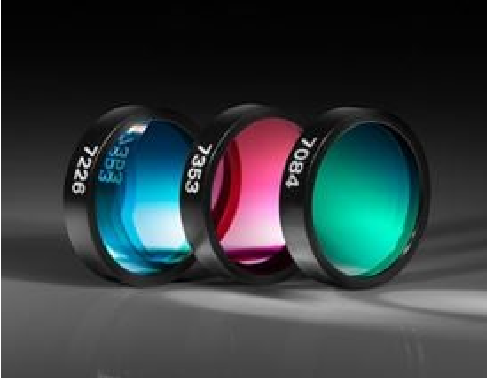
Ultra Narrow Bandpass Filters