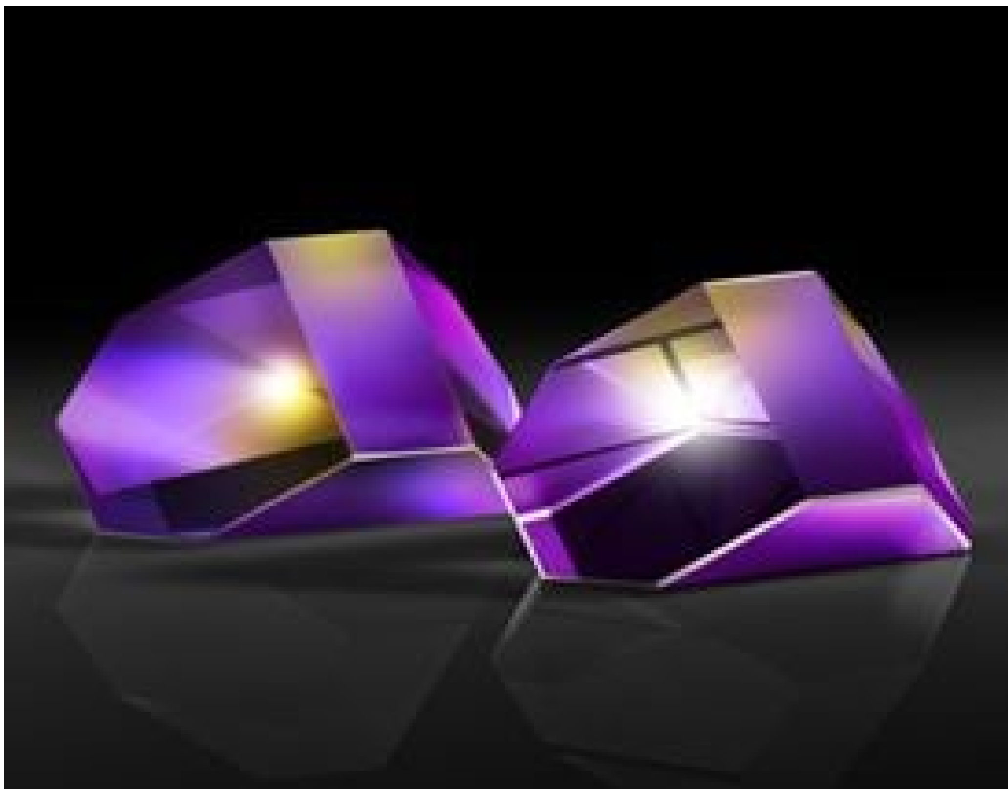
Amici Roof Prisms