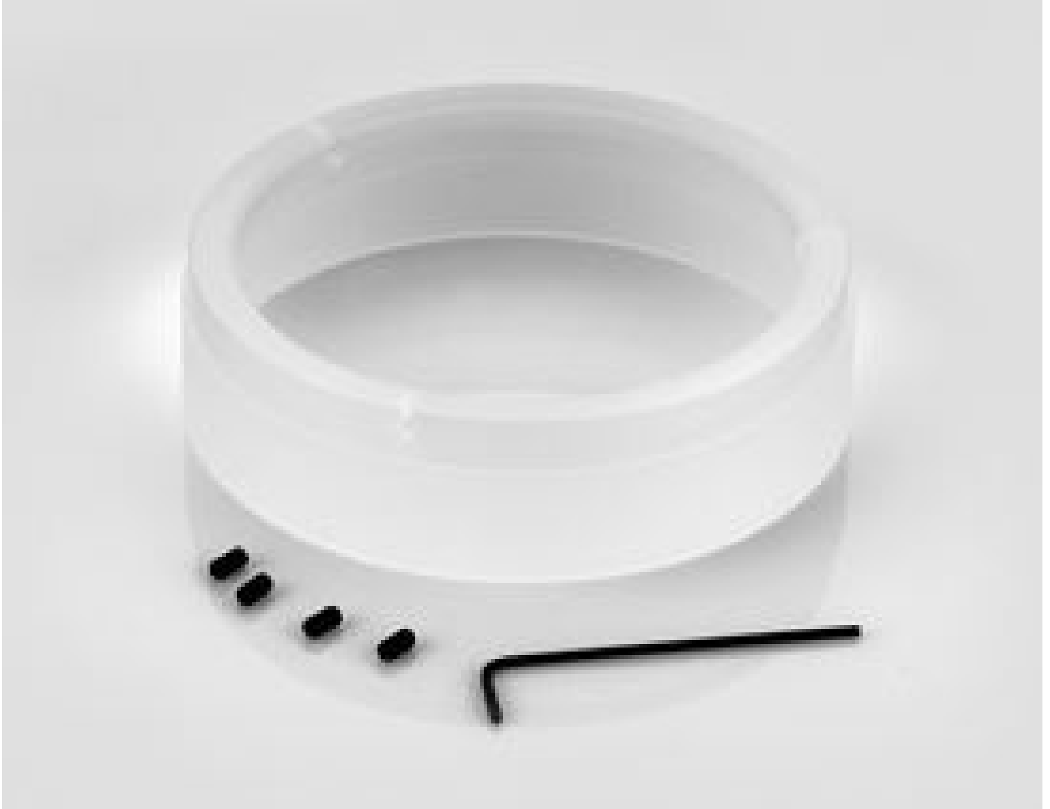
Ring Diffusion Plate