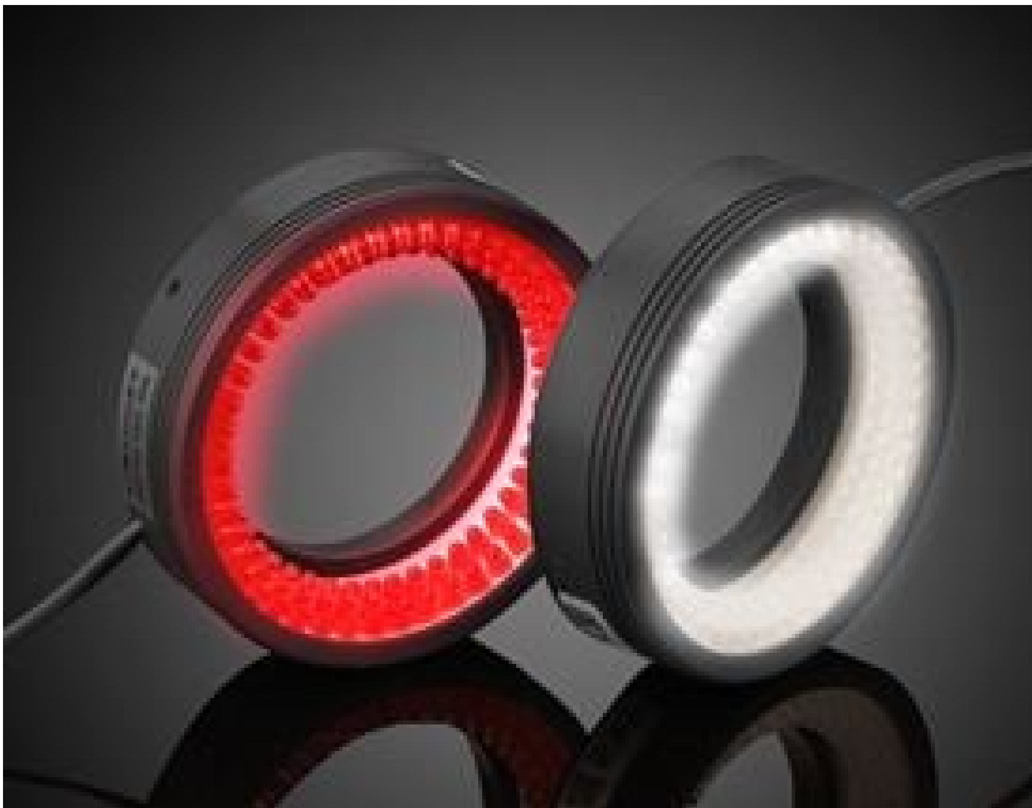
CCS Low-Angle LED Ring Lights