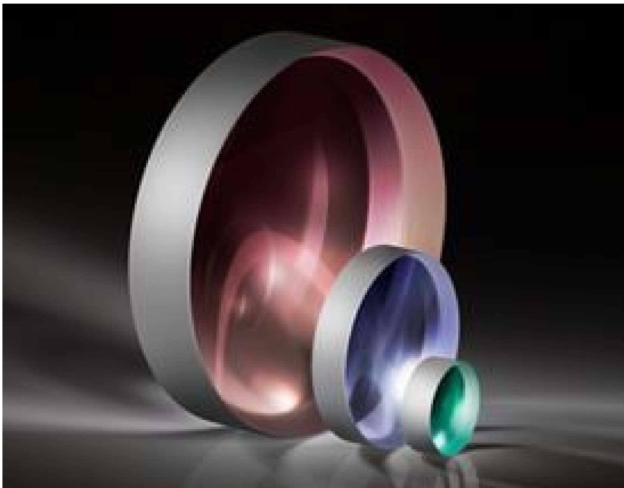
TECHSPEC VIS-NIR Coated Plano-Concave (PCV) Lenses