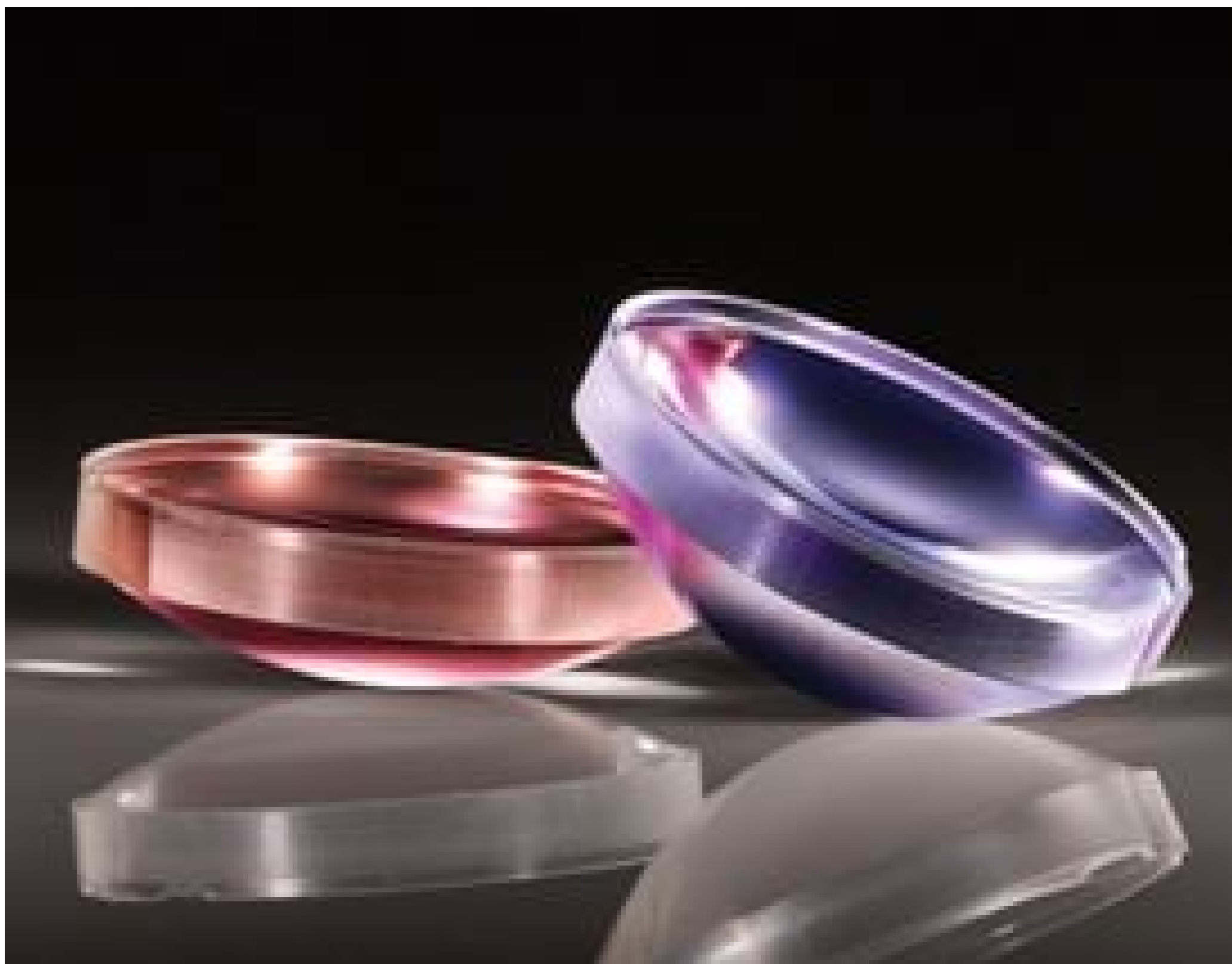
TECHSPEC® Plastic Hybrid Aspheric Lenses