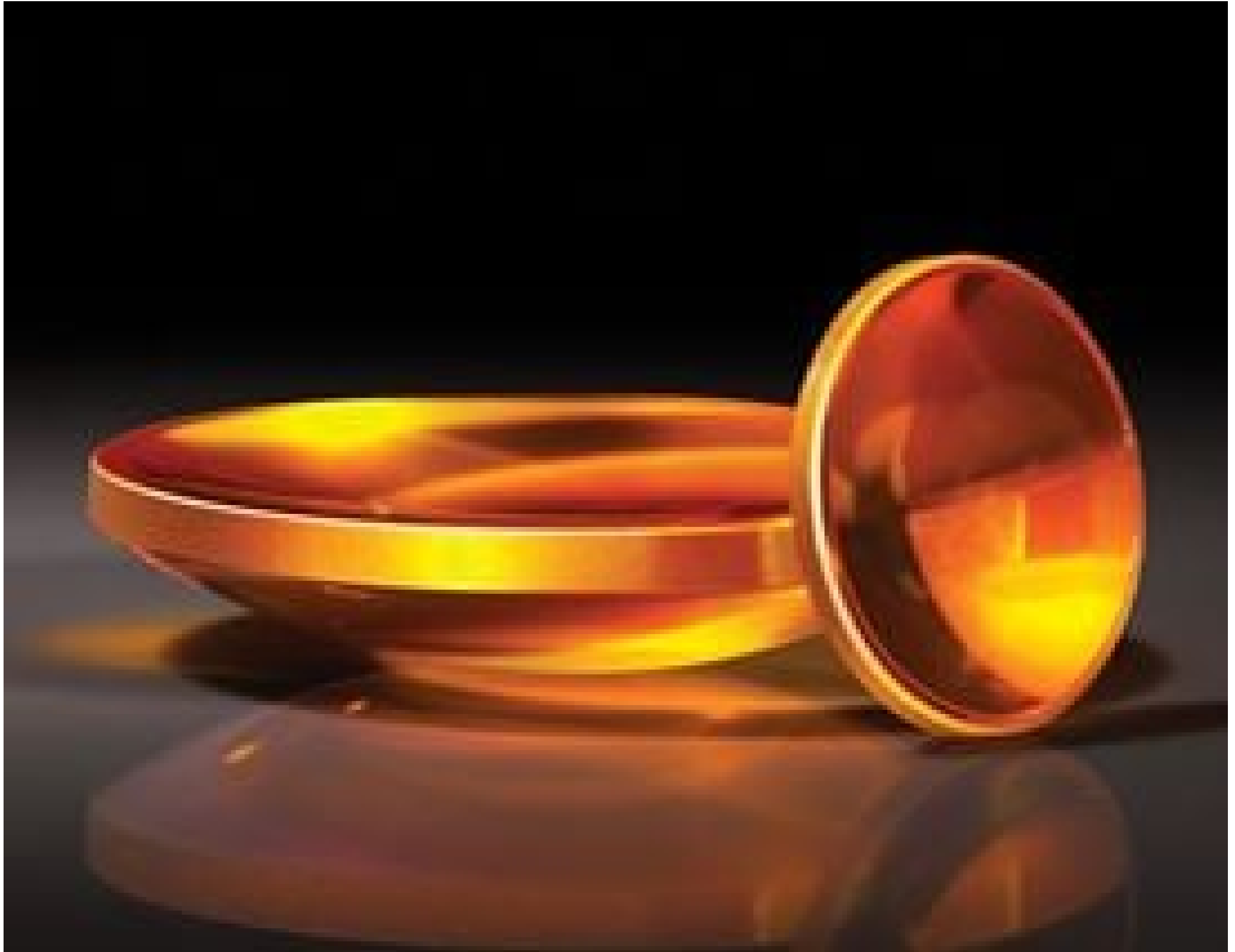
TECHSPEC Zinc Selenide (ZnSe) Aspheric Lenses