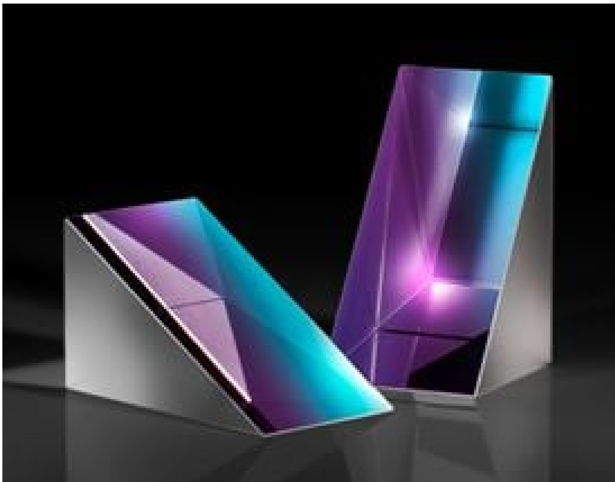
30° - 60° - 90° Littrow Dispersion Prisms