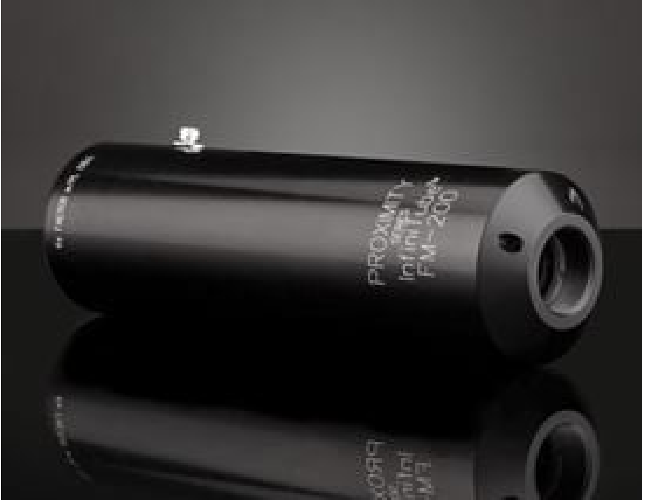
InfiniTube FM-200 (1X), #58-310

See More by Infinity Photo-Optical Company