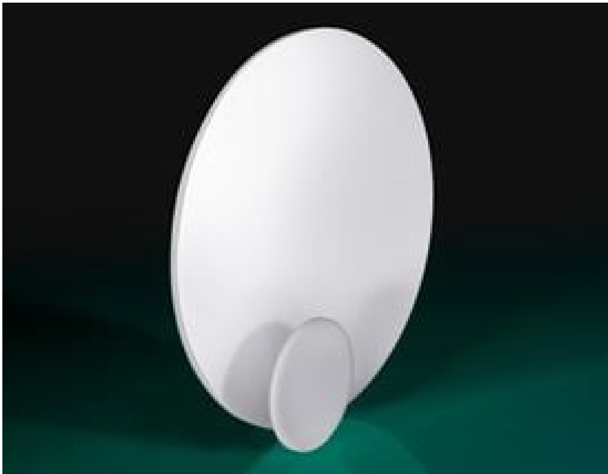
White Diffusing Glass